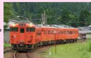
只見線40周年号(イメージ) 2両で運転します