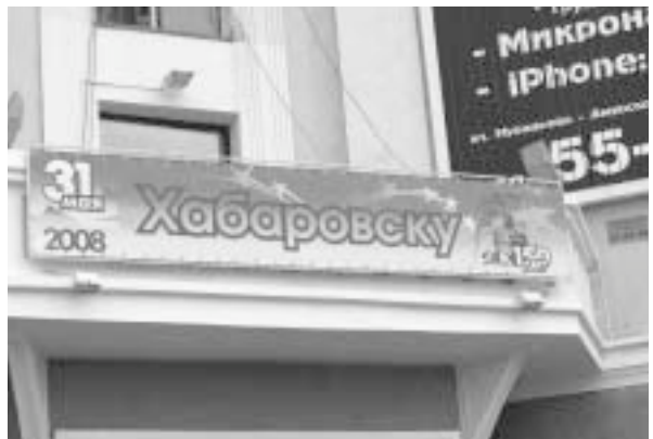
写真10 ハバロフスクは建立150周年