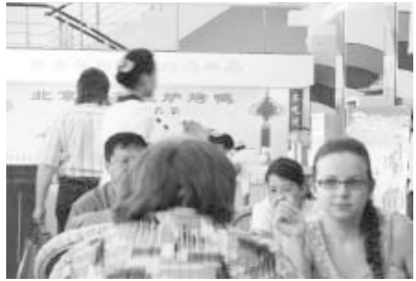
写真1 黒河のレストランのロシア人客

この中国料理レストランに限らず、市内中心部にあるケンタッキー・フライドチキンの店にも写真3のように、ロ