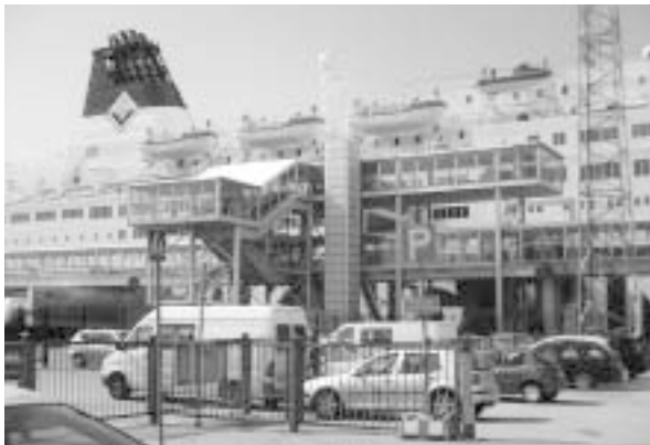
国際フェリーターミナル

ところで、ヘルシンキはバルト海（フィンランド湾）に面した美しい港湾都市であるが、会場となった会議場は、国際フェリーの発着する埠頭に隣接して立地しており、会場の窓からフェリーの出入りが間近に見ることができた。