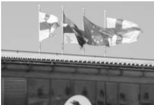
ターミナルビルに翻るフィンランドとエストニアの国旗

ヘルシンキからのフェリー航路は、スウェーデン、デンマーク、ドイツなどバルト海沿岸の各国に伸びている。その中でもフィンランド湾を挟んで対岸となる旧ソ連のエストニアのタリンとは、わずか1時間で結ばれており、日帰りも可能である。かつては“鉄のカーテン”に行き来を遮られていた隣国が、現在はまさに同一の経済圏の中に入っている。バルト海がERINAの提唱する“環日本海経済圏”の先行事例として、しばしば取り上げられるのも、納得がいく状況である。