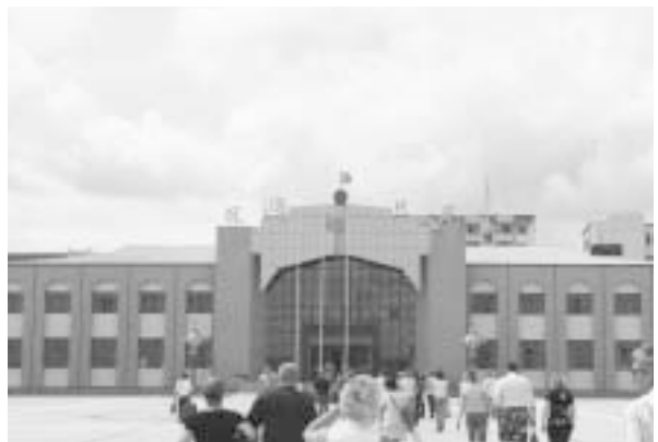
写真11 観光客でにぎわう撫遠口岸