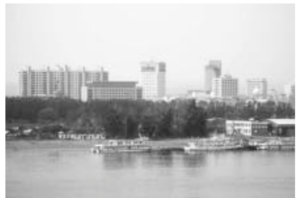
写真8 ブラゴベシenskから見た黒河