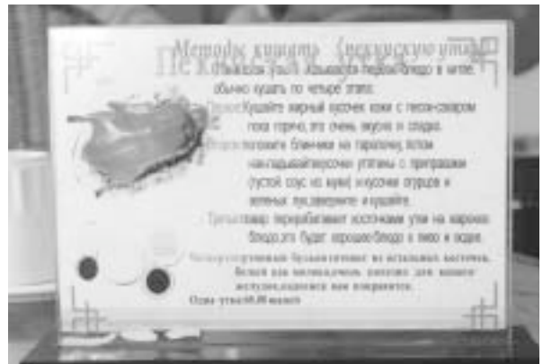
写真2 ロシア語のメニュー