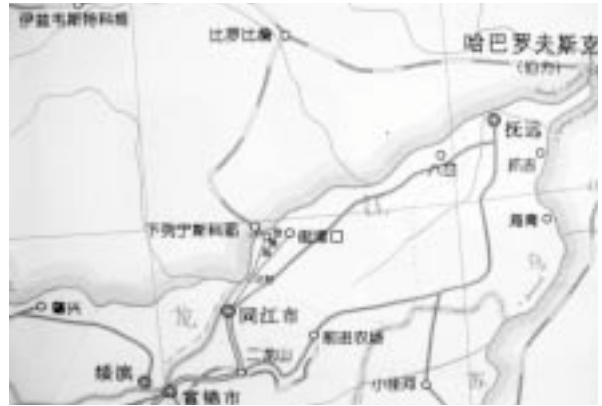
写真14 同江からロシアへ向かう交通

撫遠ではロシア人の観光客がどんな物を見て、どんな物を食べ、どんな物を買っているのかをツアーに同行して見てみたかったのだが、入国に1時間近くかかったせいで団からはぐれてしまった。入国管理の人々にも心配をかけたことだし、さっさとこの街からおさらばしようということで、バスターミナルに行き、同江行きのバスに乗った。