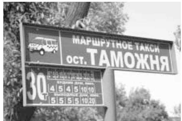
写真7 乗り合いタクシーの停留所