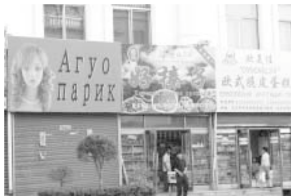
写真4 商店の看板にもロシア語が...