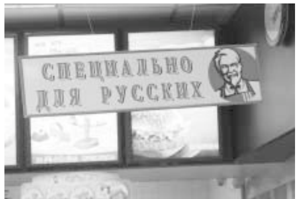
写真3 KFCの注文もロシア語で