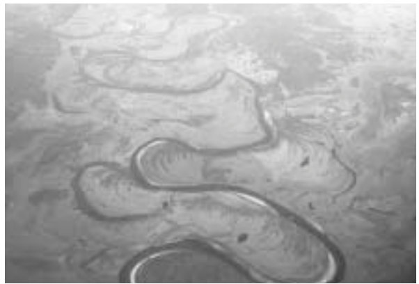
写真9 蛇行する川の上を飛ぶ

他の客たちは早々に入国審査を終え、審査場を出ていくが、私のパスポートは帰ってこない。他の入国審査官たち