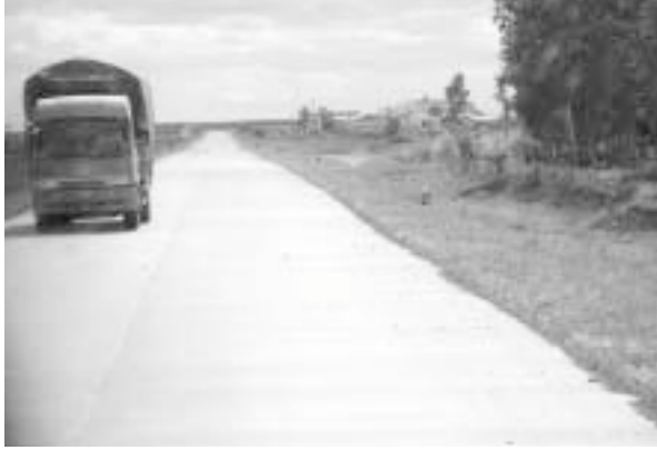
写真13 撫遠～同江の道路

が「早く審査を受ける」と促すが、パスポートがないので、審査を受けることができない。10分ほど経っただろうか、件の審査官が戻ってきて、審査事務所に通され、席を勧められる。撫遠からどこに行くのか（哈爾濱まで行って日本に帰る）お前は元中国人ではないのか（いや、生まれてからずっと日本人だ）なぜハバロフスクから直接日本に帰らないのか（ここに来る前にハルビンで会議があって往復切符を買ったから、使わないもったいない）など、いろいろな質問をされた。