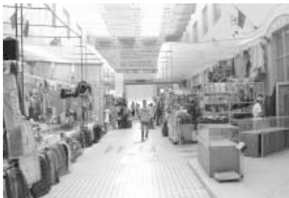
写真6 大黒河島国際商貿城の内部