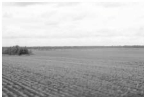
写真12 果てしなく広がる三江平原