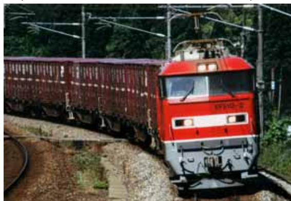
EF510形式電気機関車 (ECO - POWER レッドサンダー)