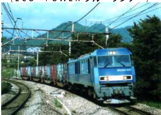
EH200形式電気機関車 (ECO - POWER ブルーサンダー)