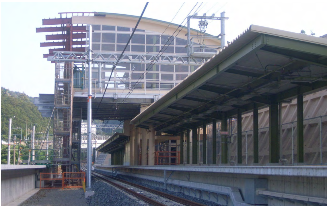
建設中の和歌山大学前駅（8月25日撮影）

当社では、地域や南海本線のイメージを高め、利用者の皆さまに親しんでいただける駅を目指します。詳細は次ページのとおりです。