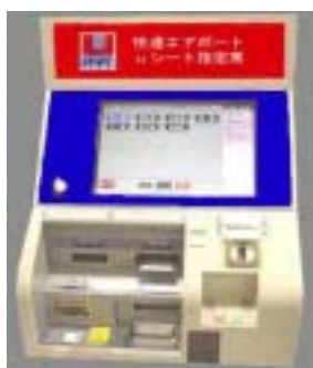
【uシート指定席券売機イメージ】

指定席「uシート」用の指定席券売機を札幌駅と新千歳空港駅にそれぞれ2台設置し、みどりの窓口と並ぶことなく、お気軽にお買い求めいただけるようになります。