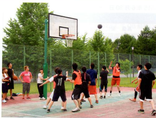
スポーツ大会(バスケットボールの例)

ぞれのやっていることや、学生に伝えたいメッセージを1人20分程度、話しました。様々な分野のスペシャリストの話に学生も時にはうんうん頷いたり、最新の研究の内容を知って驚きの表情を浮かべたり、自分が疑問を思ったことを聴いてみたりと、普段の授業とはまた違った形で活発に教師陣の話聞いていました。夜話終了後、学生を6人程度のグループに分けて、教授や助手やTAを交えてお菓子とジュースを摘まみながら懇親会を行いました。学生生活のこと、研究のこと、これか