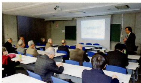
イブニングサロン風景