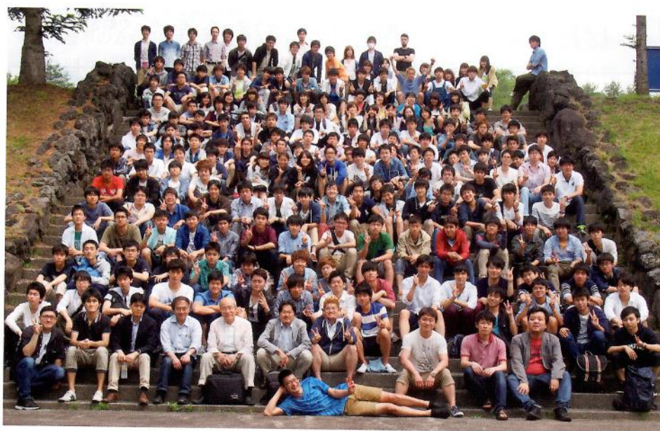
オリエンテーション集合写真

大学生活が始まったばかりのこの時期に、教員や助手やTAと交流をすることが、これからの学生生活をより楽しく、また、大学生活での目標や、やりたいことを見つけるきっかけとなればよいなと感じました。最後に、本オリエンテーションの実施にあたりご協力・ご支援をいただきました先生方、助手、TAの方々と機友会の皆様に、この場を借りて厚くお礼申し上げます。