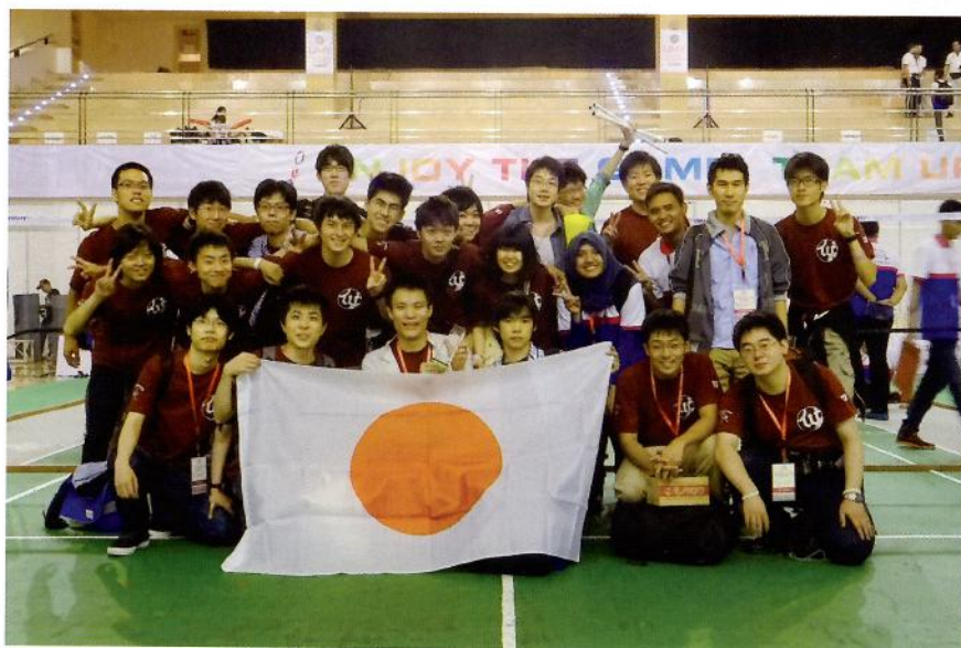
ABUロボコン世界大会