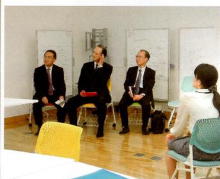
ゲストスピーカーの先生方