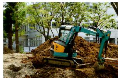
工事中の理工キャンパス

銀行口座自動引落しは毎年4月18日（休日の場合は翌日）となります。たとえば、5月に申込みをいただいても、翌年の4月からとなります。