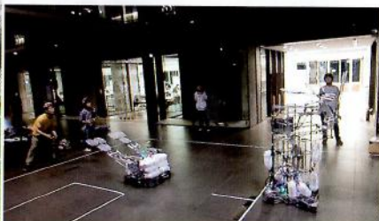
早稲田ロボコンマシン