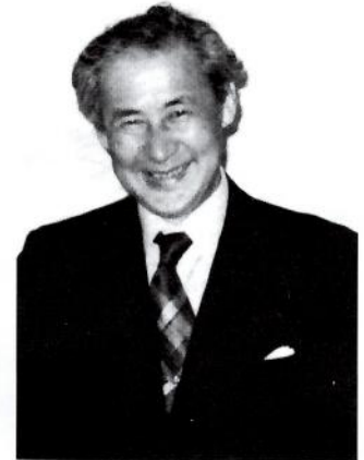
ありし日の奥村先生

また研究面では多くの研究をなされましたが、その中で複雑な機械・構造系の構造力学、座屈問題、振動問題を極めてスマートに解析できる【伝達マトリクス法】開発は特筆されるもので、