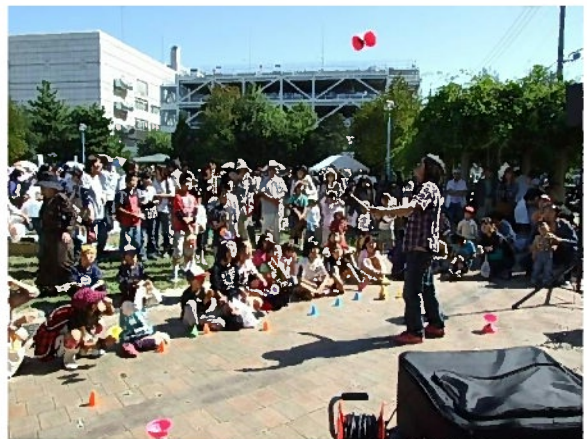
諏訪食べにおいでん祭