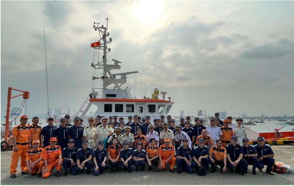
(4)ベトナム海上警察との合同捜索救助訓練