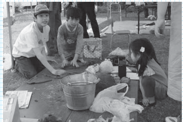
テラコッタ粘土で思い思いの作品を作る子どもたち

4月29日から5月5日の間、阿蘇フォークスクールで「うら庭バザール2011」が開催されました。これは、ゴールデンウィークにあわせて行われたもので、手仕事の体験をする竹籠作りや、自然を満喫する根子岳へのピクニックや山菜採りなどに多くの親子連れが参加し楽しんでいました。