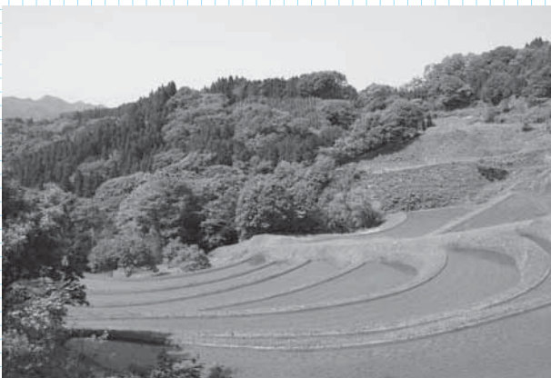
毎年多くのカメラマンの撮影スポットになっています

また、この美しい棚田の風景を撮影しようと、県内外から多数のカメラマンが訪れています。稲穂が実った収穫時期の棚田も楽しみです。