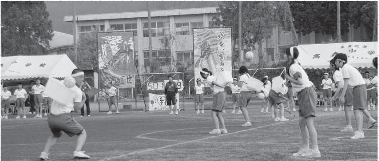
高森中学校2年生が挑戦した応用競技「おさるのかごやで川渡り」

5月21日、「高森中学校体育大会」「高森東小・中学校合同運動会」が開催されました。当日は、雨が予想されたため、雨天バージョンのプログラムに切り替えてのスタートとなりました。徒競走やかわいらしいダンス、勇壮な応援演舞などを披露した児童・生徒たちに惜しめない拍手と歓声が送られていました。