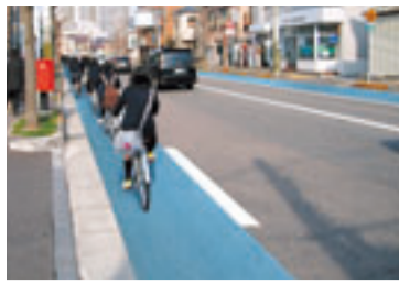
自転車レーンの走行イメージ

中央区水島町の市道小島下所島線の自転車専用レーン(370m)が完成し、あす8日から利用で