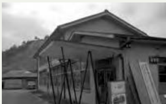
1967年4月に入間市と合併する直前の西武町役場