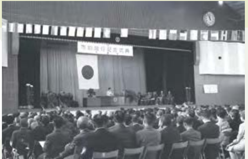
市制施行記念式典 1966年11月1日豊岡高校体育館にて