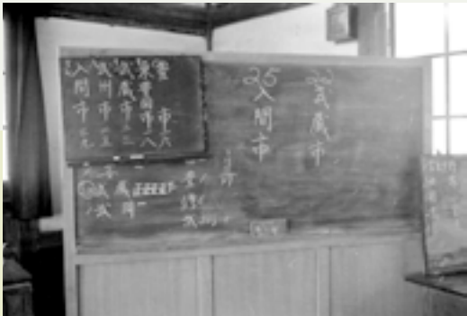
市名の決定（1966年5月12日） 公募によって全国から寄せられた新市名の中から、この地方の古来からの呼称であることなどを理由に「入間市」が選ばれました。