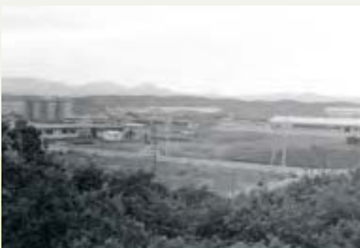
建設中の武蔵工業団地

1966年3月、旧陸軍狭山飛行場跡地に着工。工場用地の他公園や住宅用地も確保、職住のバランスのとれた「モデル工業団地」でした。この頃の入間市は県内の工業化の中核的存在でした。