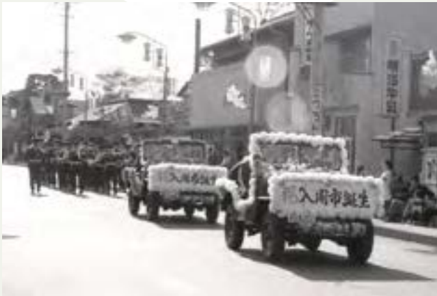
扇町屋通りを通る自衛隊のジープと音楽隊のパレード