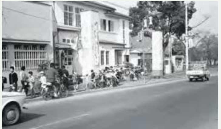
市制施行を祝ってパレードする豊岡小学校の子どもたち（旧市役所庁舎前）