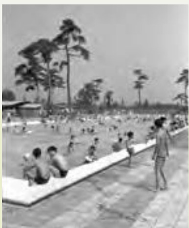
中央公園プール 1966年7月開場