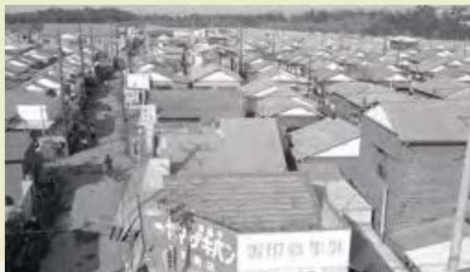
武蔵藤沢駅そばに開発された市域初の大規模な住宅地「角栄団地」の街並み