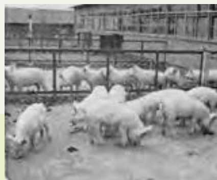
種雌豚を飼育する中神の養豚センター

1966年3月、旧陸軍狭山飛行場跡地に着工。工場用地の他公園や住宅用地も確保、職住のバランスのとれた「モデル工業団地」でした。この頃の入間市は県内の工業化の中核的存在でした。