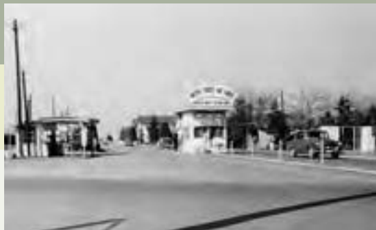
米軍ジョンソン基地

1938（昭和13）年に設立された旧陸軍航空士官学校は、戦後米空軍ジョンソン基地となりました。1958年には航空自衛隊入間基地が誕生し、米軍と共同使用されるようになりましたが、1978年には全面的に返還されました。