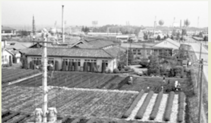
埼玉県茶業研究所 現在の入間市役所本庁舎の場所にありました