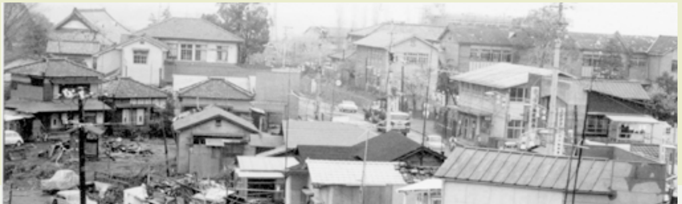
市制施行の頃の官庁街（市役所、豊岡小・中学校、豊岡公会堂、郵便局など）