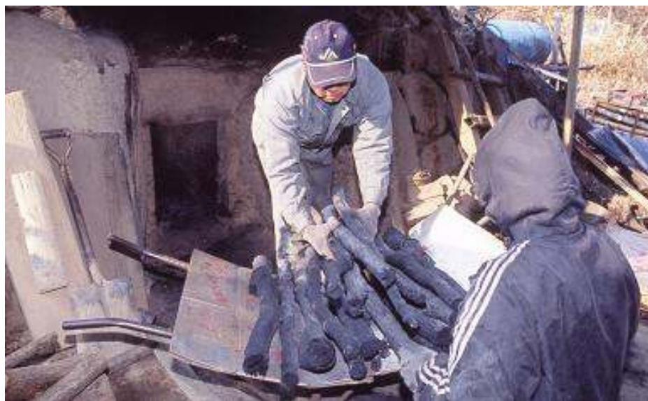
黒川ダリア園 一庫炭