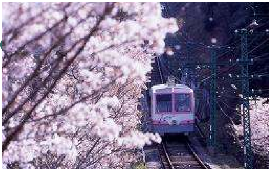
能勢妙見ケーブル