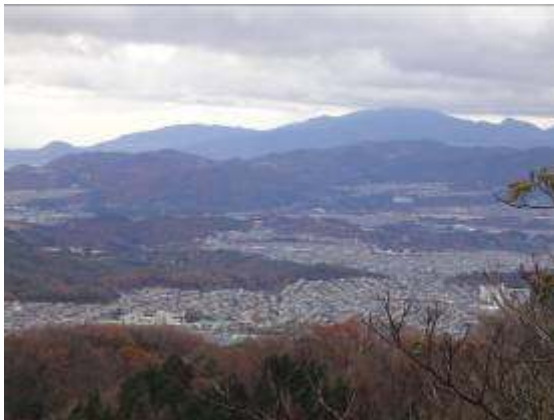
大和、清和台、けやき坂地区を一望