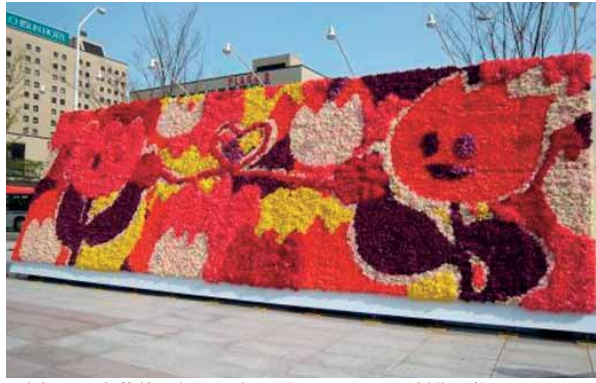
昨年巨大花絵。約200人のボランティアが制作に携わりました

球根育成のために摘み取り捨てられるチューリップの花を利用して巨大花絵を制作する、にいがた花絵制作プロジェクトの花絵制作ボランティアを募集します。 完成した花絵は、新潟駅南口中央広場に5月2日まで展示します。 日時 4月29日(祝)午前8時～午後4時 集合場所 新潟駅南口 内容 花畑で花摘み(午前)、新潟駅南口中央広場で花絵制作(午後) ※花畑(選定中)へはバスで移動 定員 20人(応募多数の場合抽選) 申込 4月5日(金)曜(消印有効)までに、参加者全員の氏名・年齢・代表者の住所・氏名・年齢・電話番号を