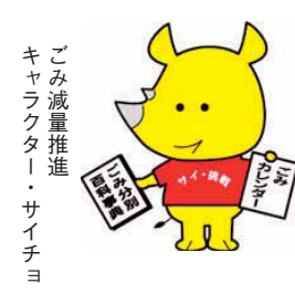
ごみ減量推進キャラクター・サイチヨ

はがき(〒951-8550)、FAX(025-230-0423)、メール(shokuhana@city.niigata.jp)のいずれかで食と花の推進課(☎025-226-1794)へ