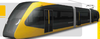
芳賀・宇都宮LRT車両