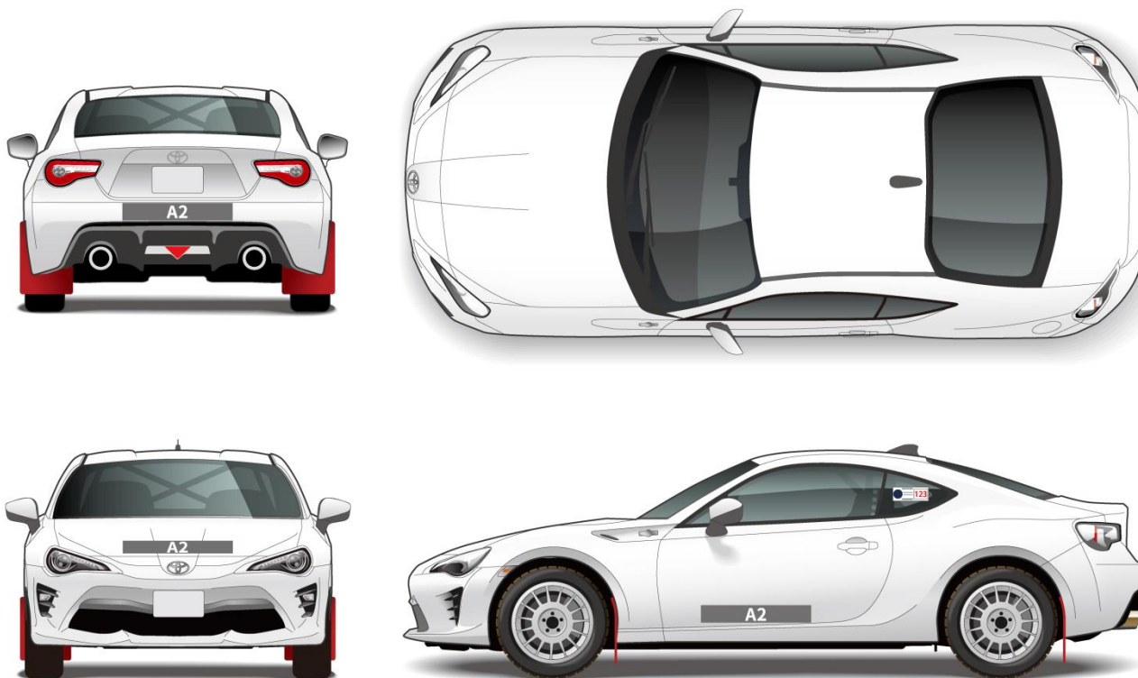
付則3 TGRRC事務局指定貼付位置 (TOYOTA GAZOO Racing Rally Challenge Joint cup)