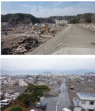
▲震災後の岩手県山田町