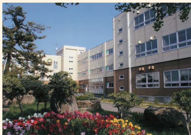
弘前大学教育学部附属中学校

昭和16年満州ハルビン生まれ。 昭和20年両親の故郷である青森県弘前市に引き揚げる。 弘前大学教育学部附属弘前小学校・中学校卒業。 昭和33年県立弘前中央高等学校卒業。 昭和38年弘前大学教育学部家政学科卒業。 弘前大学教育学部附属弘前中学校・附属中学校勤務。 平成13年弘前大学教育学部附属中学校退職。 弘前大学教育学部非常勤講師(～21年)。 現在、弘前厚生学院非常勤講師・平川市社会教育委員・学校評議員・知的障害施設のオンブズマンなど。