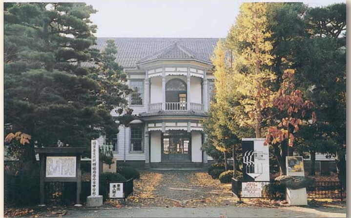
▲震災前の安積歴史博物館