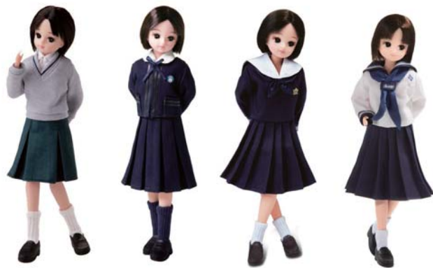
宮城県第三女子高校

今年度は「栃木県立佐野女子高校（現佐野東高校）」と「宮城県第三女子高校（現仙台三枝高校）」が新たに仲間に加わります。両校とも女子校から共学校へ移行し、思い出の女子校時代の制服リカちゃんです。