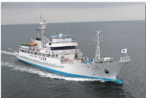
焼津水産高等学校の実習船「やいづ」

※長期にわたって漁業の不振が言われているなか、焼津水産高等学校はむしろ活発化しており、航海、漁業、水産加工その他の水産関係のプロを目指し、現在五百人近くの生徒が学んでいる。年に六回ほどの実習航海もあり、生徒は専攻にかかわらず在学中一回は乗船し航海を体験する。大学進学者を除く卒業生の就職率は一〇〇%。漁師になるのは全体の二〇%くらい。元気のいいユニークな高校としてマスコミに取り上げられることも多い。