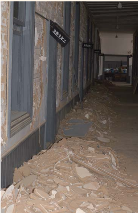
▲二階中央廊下。ほとんどの漆喰が剥がれ落ち、入ることはできない。

安積桑野会（福島県立安積高等学校同窓会） http://www.asaka-kuwano.jp/ 〒 963-8851 福島県郡山市開成 5-25-63 福島県立安積高等学校内 TEL (024) 922-4310(代) FAX (024) 931-5313