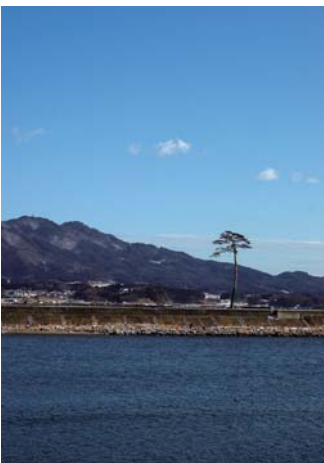
今回の東日本大震災からの復興のシンボリックな存在となった陸前高田市の「一本松」

今回「同窓会のチカラ」第四号を発行するにあたり、私たちはこうした視点から震災に際して、同窓会や学校で具体的にどのような活動があったのかを調べ、報告することに致しました。もちろん日本中で無数の支援活動が行われたことでしょうし、それは現在も継続していることと思います。残念ながら限られたページ数では、知り得た全てを載せることは出来ません。ここにあるのは、ごくわずかの事例ではありますが、これからの同窓会活動の一助となることを願つてご紹介する次第です。■