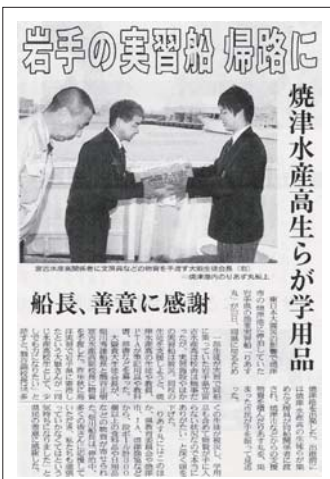
静岡新聞・2011年4月24日の記事

五月、宮古水産高等学校から感謝状が届きました。世界的な魚の需要が増すなか資源としての魚は減少し続け、日本の水産業にもやや翳りが見えています。私達は同じ水産高校として、格別の友情と連帯をもって今後とも宮古水産高校と交流を深めていきたいと考えております。その一つとして、二〇一二年の春、可能ならば実習航海の際に宮古港に寄港し、宮古水産高校と交流会を開きたいと企画しています。