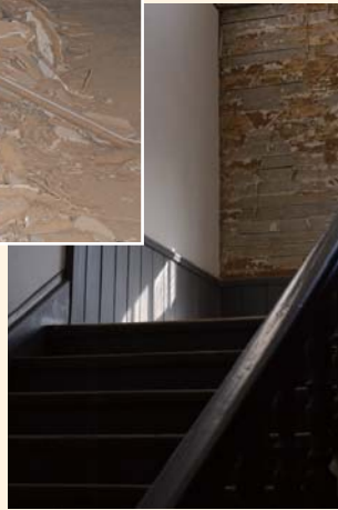
剥がれ落ちた階段の漆喰 ▶