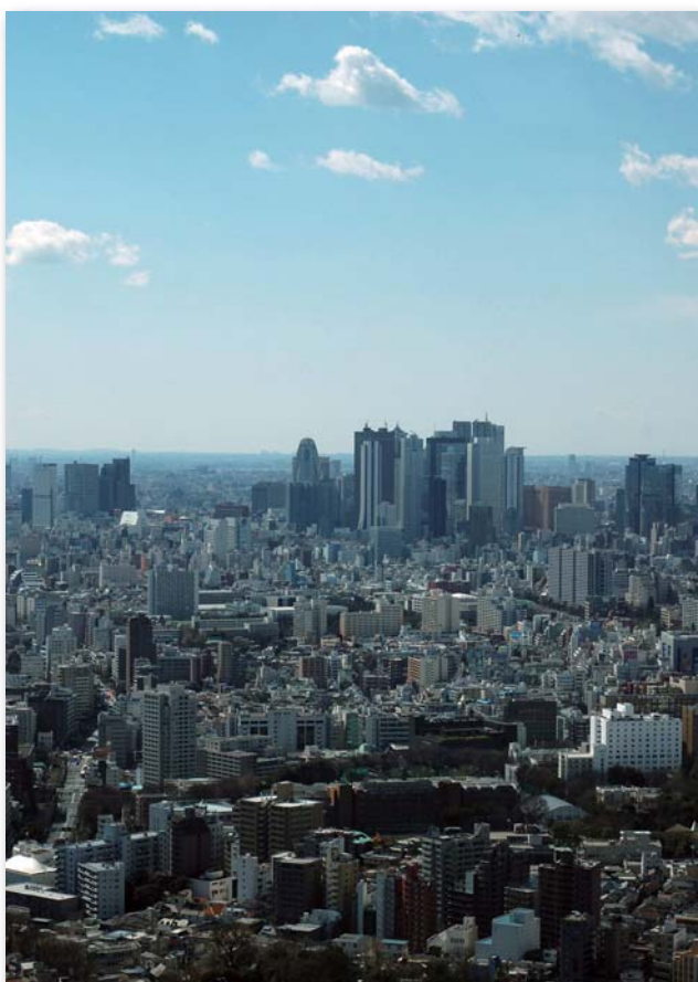
▲緑丘会館から新宿副都心を望む