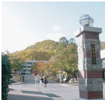
▲小樽商科大学正門

公益社団法人 緑丘会 http://www.ryokyu-web.net/ E-mail : ryokkyukai@axel.ocn.ne.jp 公益財団法人 小樽商科大学後援会 http://otaru-uc-koenkai.net/index.html E-mail : info@otaru-uc-koenkai.net 〒 170-6057 東京都豊島区東池袋 3-1-1 サンシャイン 60 ビル 57 階 TEL 03-3981-2340