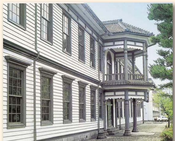
▲震災前の安積歴史博物館／奥に安積高等学校が見える