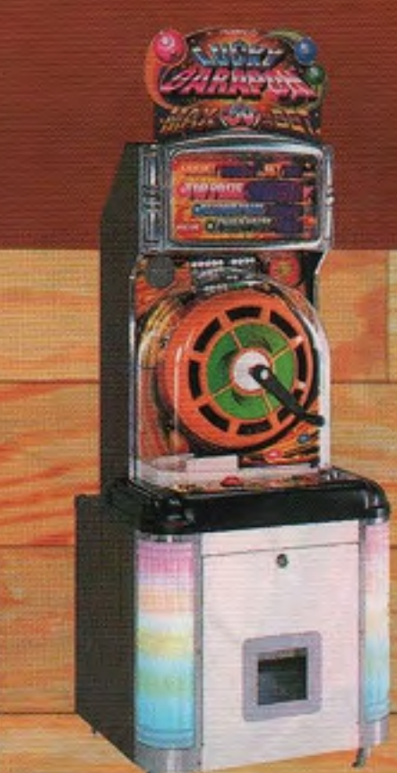
ラッキーガラボン