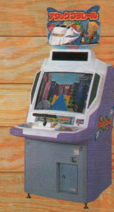
アタックブラレール ※「ブラレール」は株式会社トミーの登録商標です。