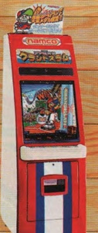
ファミスタ グランドスラム ※筐体はCGイラストです。