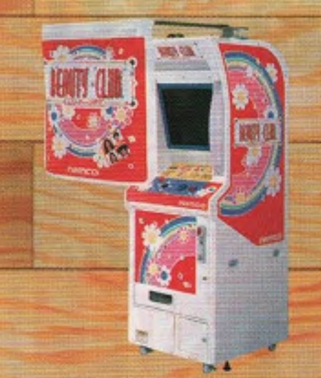
ピューティークラブ バージョンアップキット ウィンターバージョン (仮称) 11月発売予定