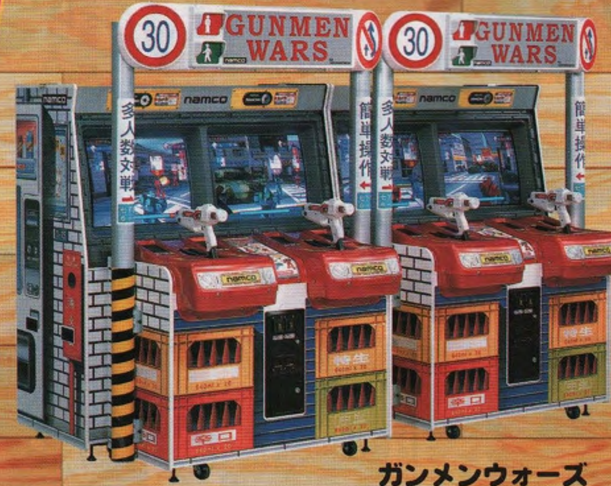
ガンメンウォーズ