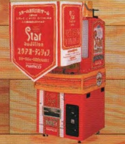
スタア オーディション (仮称)