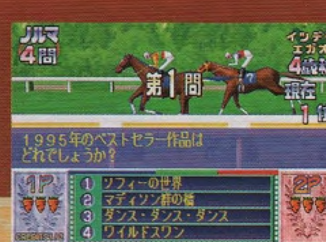
ダービークイズ マイドリームホース ※画面は開発途中のもです。