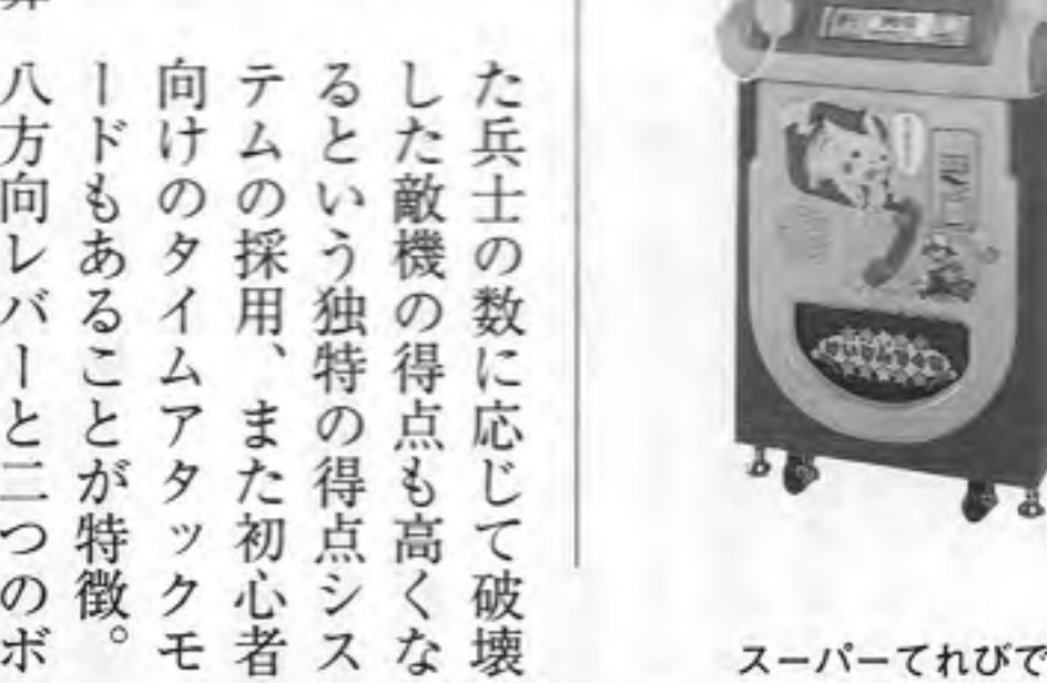
スーパーてれびでんわ

新得点加算方式 日本システムから基板で兵士を取れば得点が加算されるとともに、獲得した兵士の数に応じて破壊した敵機の得点も高くなるという独特の得点システムを採用、また初心者向けのタイムアタックモードもあることが特徴。八方向レバーと二つのボタンを操作する。 自機とサブウェポンを各三種類、スピードを四種類から選択。ショットはボタンを押し続けるとバワルショットになる。これは自機より大きくて強力なミサイル、自機の周りを回りビーム弾ともなる光の弾、ロックオンし爆発するノコギリ型円盤の三タイプがある。二人同時プレイ、途中参加も可能。基板販売でOP価格十六万八千円。