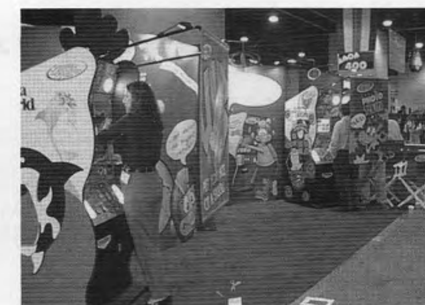
APBI's booth in AMOA Expo '97

In order to develop "Print Club 2" in the USA, Atlus established Atlus Dream Entertainment (ADE), a joint venture with Sega, Itochu, etc. in October 1997, and transferred Image Software's patent (called "Barber