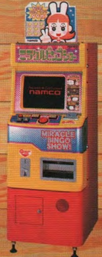
ミラクル ビンゴショー