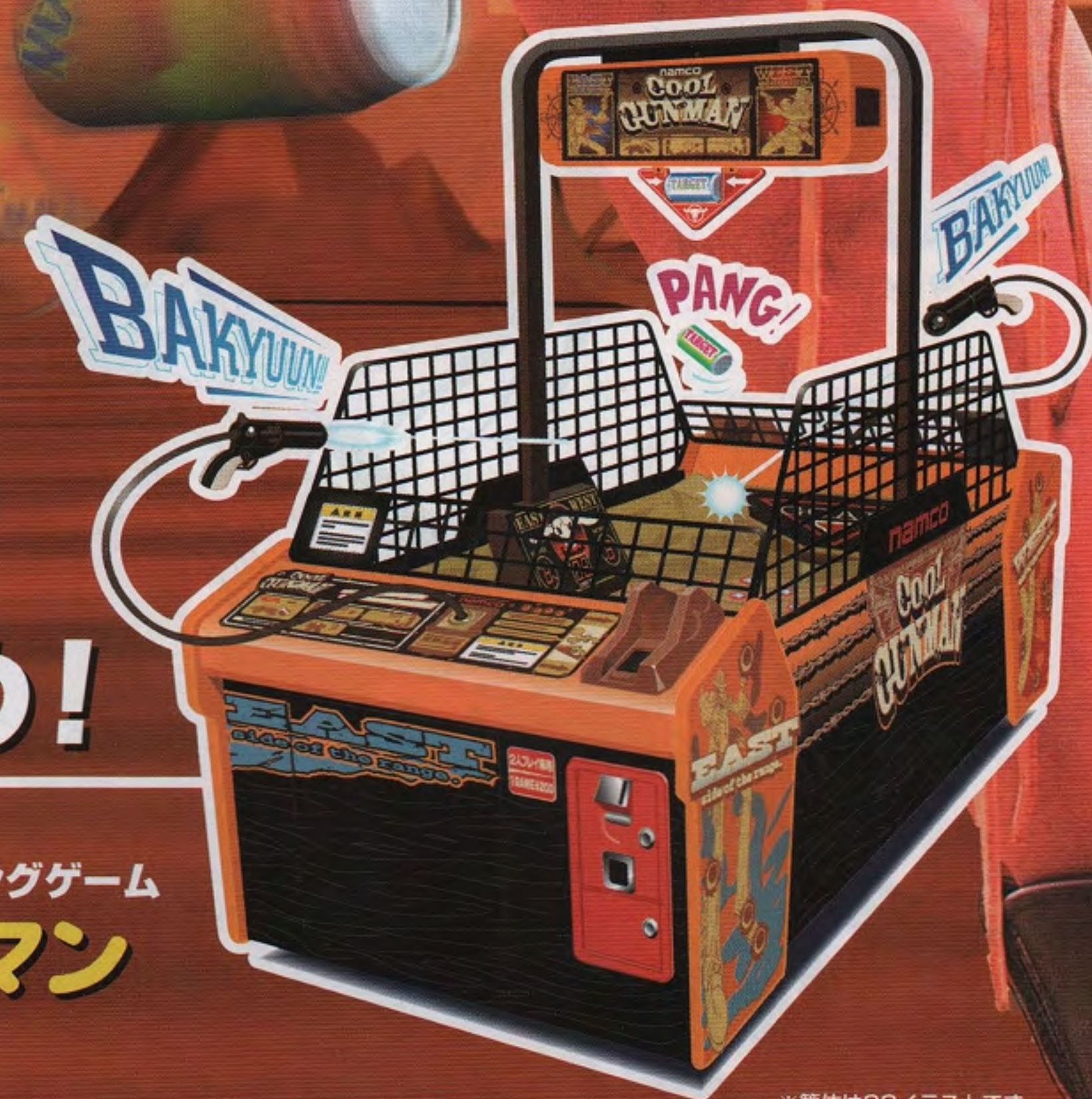
アクションガンシューティングゲーム クールガンマン