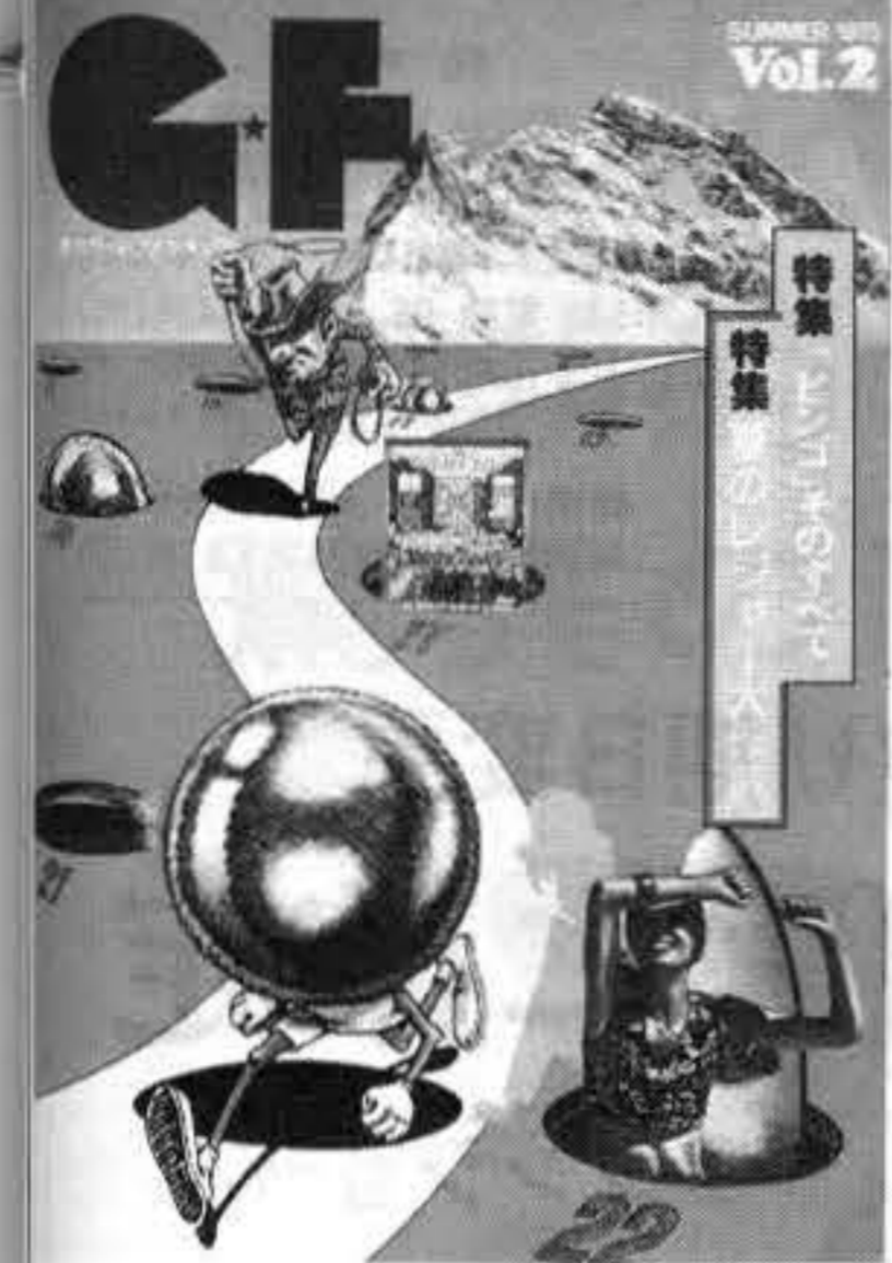
「ゲームファンタジア」第二号の表紙イラスト。ビンゴの遊び方を紹介している。

「ゲームファンタジア」第二号は、ビンゴの扱いが非常に豊富であることが特徴である。ビンゴは、昔ながらの娯楽活動であり、多くの人々に愛されている。この雑誌では、ビンゴの新しい楽しみ方、そして、ビンゴの歴史や文化についても詳しく紹介されている。