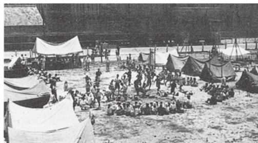
【12月】京都市立明倫小学校で日本ボーイスカウト京都連盟の結成式を挙げる。

(1949年) 【4月】関係官庁の許可を受け「財団法人ボーイスカウト日本連盟」が設立される。京都からは7個隊が加盟登録。【8月】承認された7個隊と準備隊1個隊の計8個隊130名の参加で、当時GHQが使用していた岡崎グラウンドにて「第1回京都キャンボリー」を開催。この時、特に許されて国旗「日の丸」を掲げた。