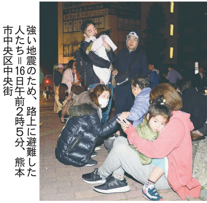
強い地震のため、路上に避難した人たち=16日午前2時5分、熊本市中心区中央街