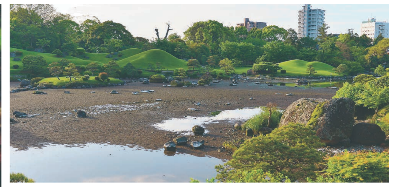
干上がった水前寺成趣園の池=16日午前6時50分、熊本市中心区