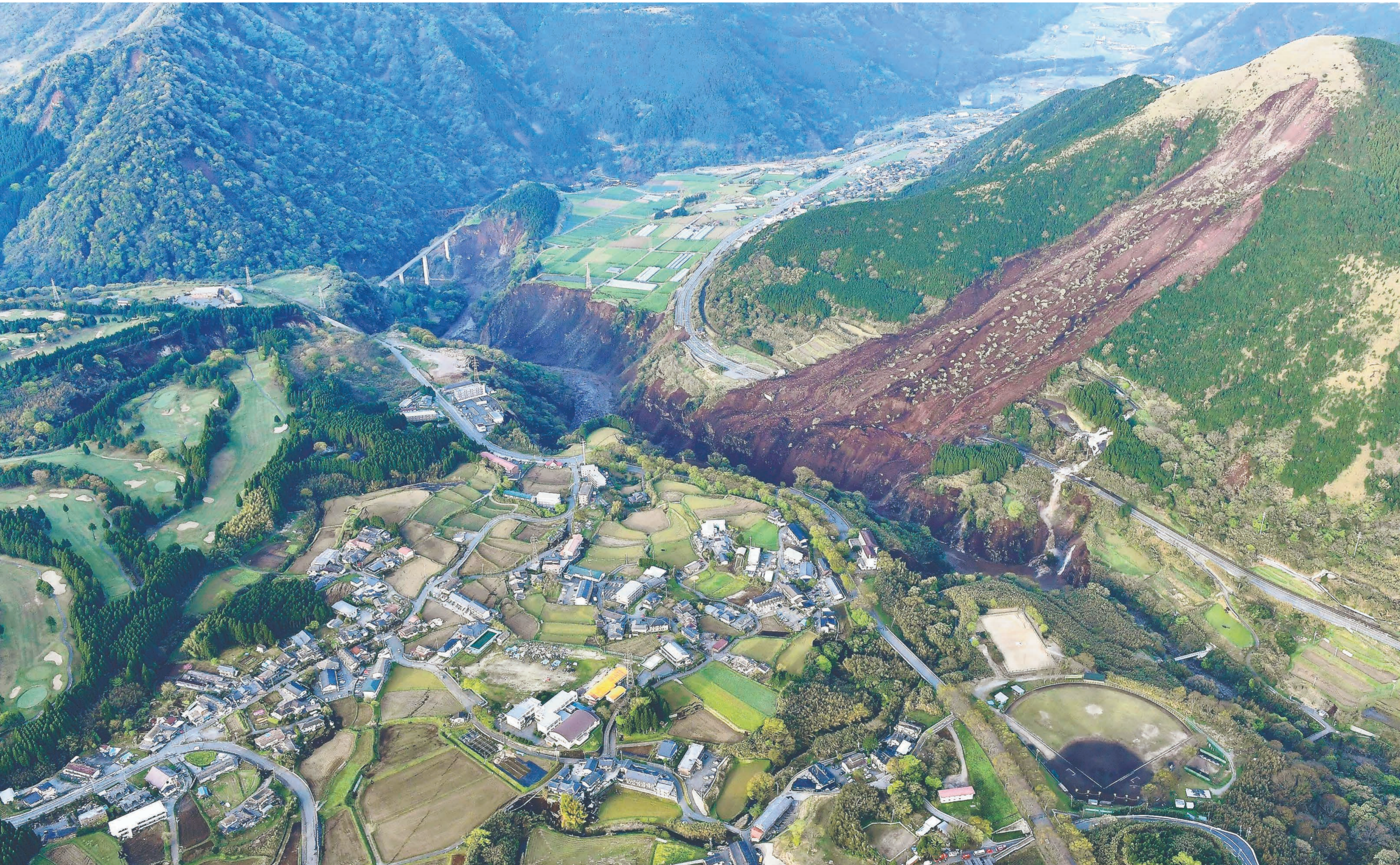
地震の被害を受けた南阿蘇村。山では土砂崩れが発生し、阿蘇大橋が崩落した =16日午前6時43分

16日午前1時25分ごろ、熊本市、宇城市、南阿蘇村、菊池市、合志市、宇土市、大津町、嘉島町で震度6強の地震が発生し、その後も震度6強の地震など強い揺れが続いた。県災害対策本部によると、南阿蘇村などで家屋の倒壊など甚大な被害が出ている。県警は午前7時半までに2人の死亡を確認し、さらに増える可能性がある。熊本地震の死者は計11人になった。