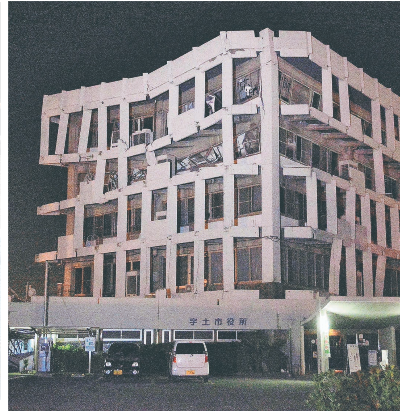
鉄筋コンクリート5階建ての宇土市役所。未明の強い余震で外側の柱が折れ半壊状態となった=16日午前4時35分すぎ (丸山宗一郎)