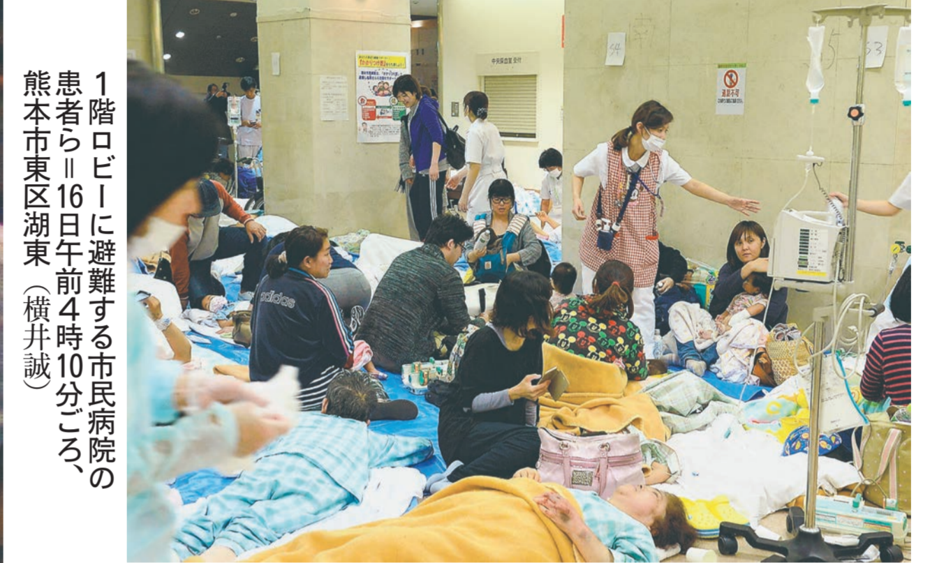
1階ロビーに避難する市民病院の患者ら=16日午前4時10分ごろ、熊本市東区湖東