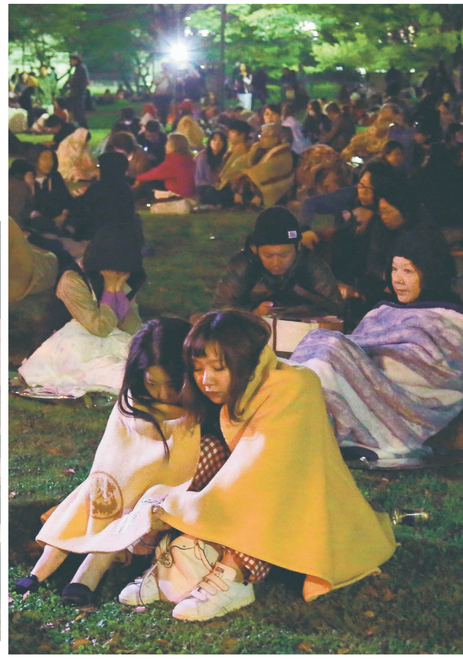
強い地震で、熊本市の白川公園に避難した住民ら=16日午前3時8分