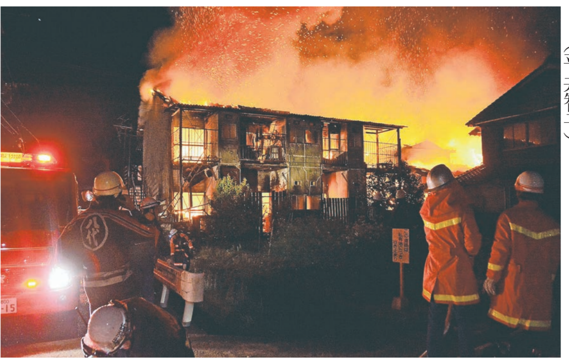
八代市松崎町でアパートと民家を全焼した火災=16日午前4時ごろ