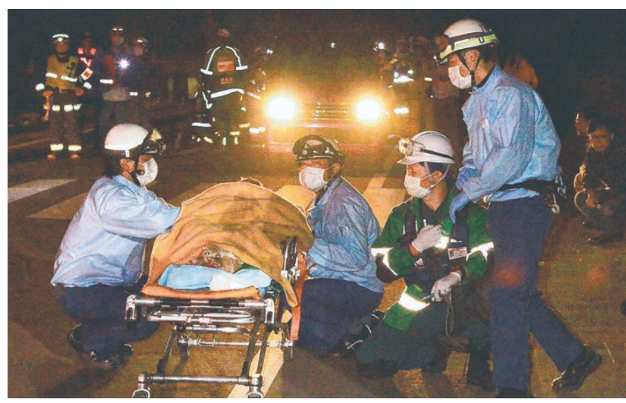
大きな揺れが発生し、腰をかがめて揺れがおさまるのを待つ救急隊員ら=16日午前1時25分すぎ、益城町の東熊本病院