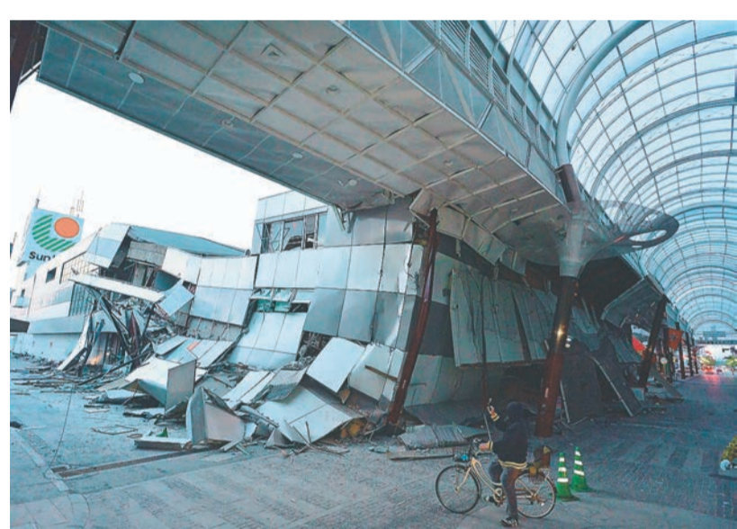
地震で倒壊した健軍商店街にあるサンリブ健軍店=16日午前5時40分ごろ、熊本市東区 (高見伸)