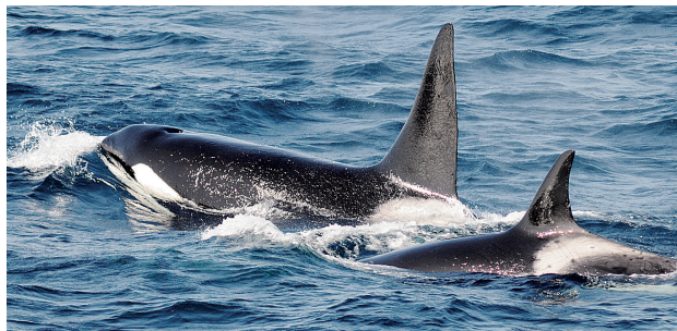
図 1. シャチの群れ 雄の背鰭は直立して高い。