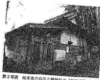
第3写真 岐阜県の白川八幡神社の「御神酒殿」(2014年11月撮影)