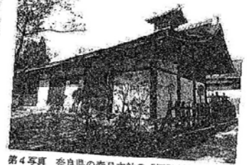
第4写真 奈良県の春日大社の「酒殿」(2015年1月撮影)

いう常設展示館があって、佐香神社と同じ明治29年に酒造免許を得たことなど様々な資料が展示されています。御神酒殿での醸造がいつごろ止まったかについては触れられていませんが、白川村役場のウェブサイトには「どぶろくは昭和年間(708年~714年)頃から、すでに祭礼用として用いられていたと伝えられています」とあります。