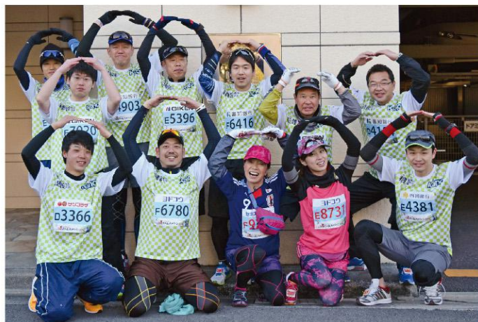
スタート前にみんなで「わ」っと!記念撮影。

高知龍馬マラソンのキャッチフレーズは、“わざわざ高知で走ろう!”。今回は岡山支店の社員も参加しました。岡山の皆さんも、来年はわざわざ高知で走ってみませんか?