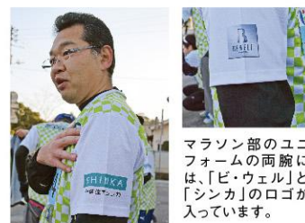
マラソン部のユニフォームの両腕には、「ビ・ウェル」と「シンカ」のロゴが入っています。