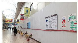
帯屋町2丁目アーケードに面したこの場所にオープン。ダイエー閉店から約10年を経て、商店街が賑やかに、もっと便利で楽しい場所になります。

今年はおまちにもう一度にぎわいを取り戻すスタートの年です。新図書館が開館する頃には、かなりの人がこのエリアを活用するようになり、街の雰囲気もずいぶん変わるでしょう。私もその姿を今からとても楽しみにしています。