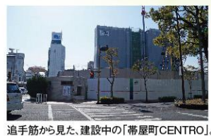
追手筋から見た、建設中の「帯屋町CENTRO」。

※記事やイラストマップなど、2015年2月中旬現在の計画や取材により制作しています。