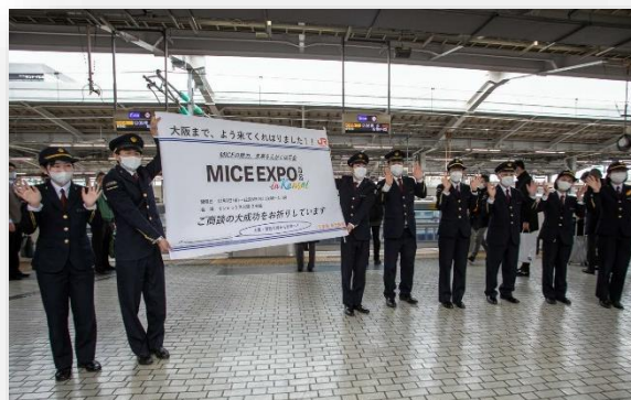
駅員のグリーティングと横断幕