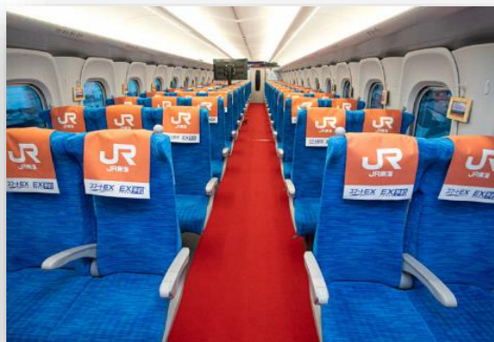
レッドカーペット