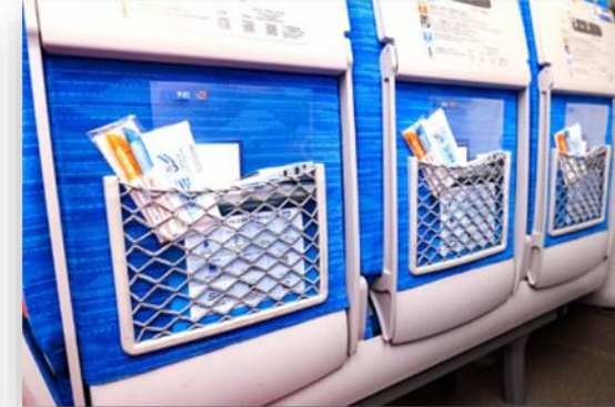
網袋へのパンフレット等設置