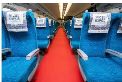
レッドカーペット