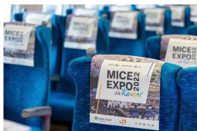
オリジナルヘッドカバー

車内で特別な体験や演出を可能とするために、東海道新幹線車内やご利用される駅にて、各種オプションメニューをご用意しています。（以下一例）