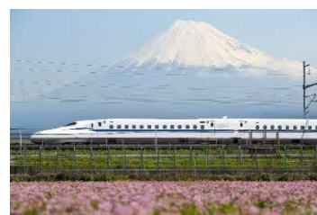
東海道新幹線 のぞみ号 (イメージ)