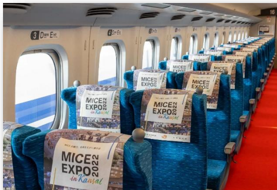
オリジナルヘッドカバー

お客様にデザインいただいた オリジナルヘッドカバー の設置や貸切車両の通路に レッドカーペット を敷設できます。また、車内に搭載した 液晶モニター や音響設備（スピーカー）をご利用いただき、好きな 映像 や 音楽 を車内でお楽しみいただくこともできます。さらに、 車内広告枠 をお好みの写真で飾り付けることや、網袋にオリジナルの パンフレット・ノベルティ 等を設置することも可能です。