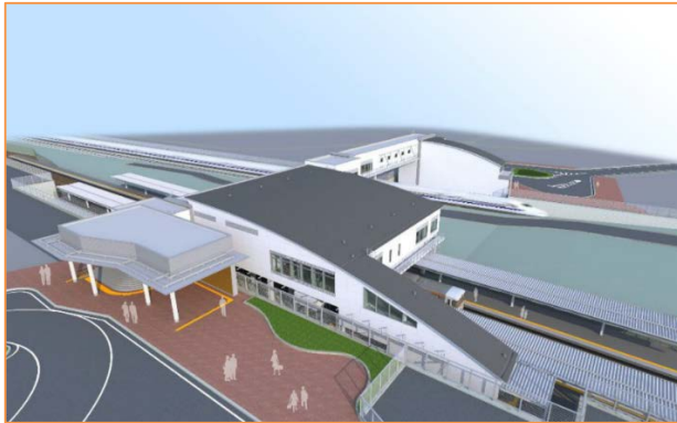
御厨駅完成イメージ

東海道線の袋井～磐田間に「御厨(みくりや)」駅(静岡県磐田市鎌田)を開業します。