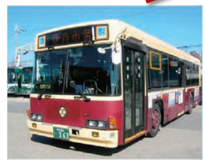
創業50周年事業の一環で限定3両製造(平成11年)