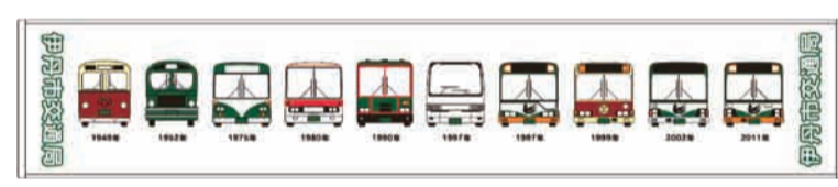
マフラータオル 700円(税込)

戦後間もない昭和24年、一面に田畑が広がるなか、当時の阪急伊丹駅(現在の中央4丁目2あたり)から春日丘―瑞ヶ池―荒牧―西野―昆陽里を経由して阪急伊丹駅に戻る経路でバス事業がスタートしました。創業当時は、三菱電機伊丹製作所で試作された電気バス4台が運行していました。 しかし、人口急増で新設・延長される路線や、年々整備される道路に合わせて運行路線距離が伸長するにつれ、長距離を運行する性能に優れたガソリン車、大型で輸送能力が高く経済的なディーゼル車が導入され、昭和27年に電気バスは姿を消しました。