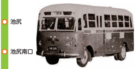
創業当時の電気バス(昭和24年)