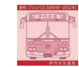
ジャガードタオル 300円(税込)