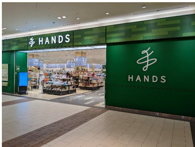
ハンズらぽーと豊洲店