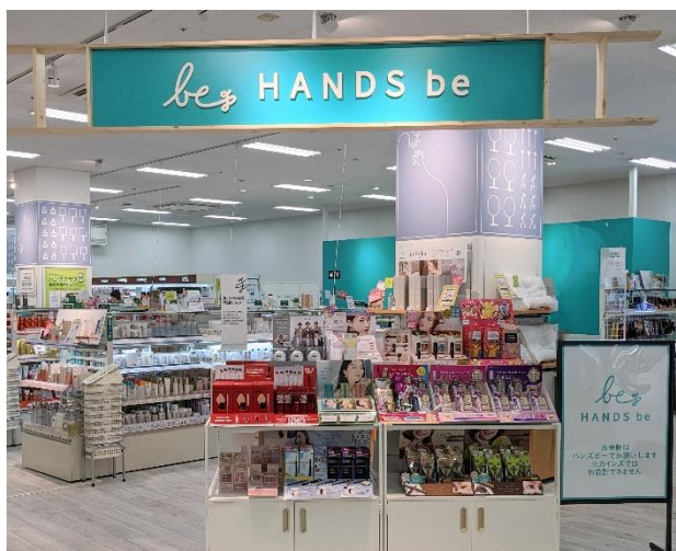
ハンズ ビー西友福生店