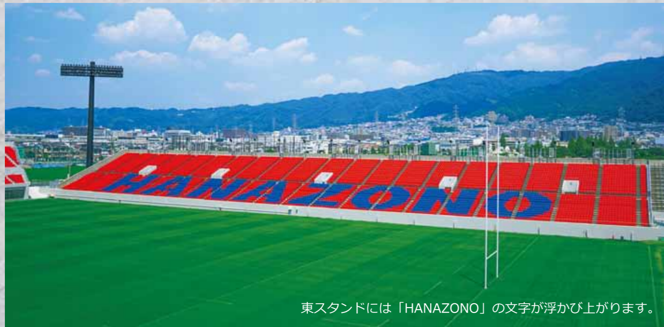
東スタンドには「HANAZONO」の文字が浮かび上がります。