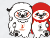
大会公式マスコット「レンジー」