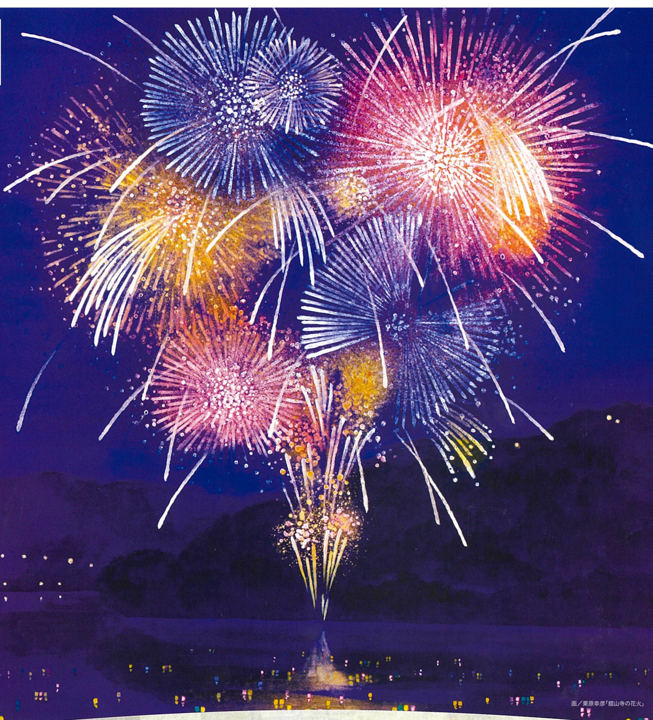
画/東京幸彦「館山寺の花火」