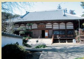
十九番札所 宥勝寺