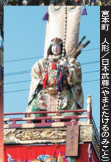
宮本町 人形／日本武尊(やまとたけるのみこと)