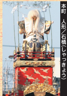
本町 人形／石橋(いしきょう)