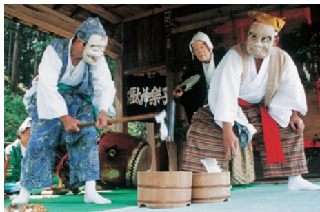
金鎖神楽太鼓組 (市指定無形民俗文化財) 武蔵二の宮金鎖神社の附属神楽として、鎌倉時代に神楽田楽等勃興と共に神社特有の神楽が組織されたものの流れを汲んでいます。