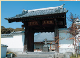
三十番札所 潤龍寺