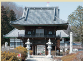
三十一番札所 長泉寺