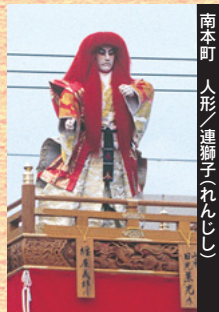
南本町 人形／連獅子(れんじし)