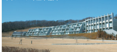
インキュベーション・オン・キャンパス本庄早稲田

地元のベンチャー企業等が公募審査を経て入居し、早稲田大学大学院のグループと共に、産学連携による新技術や新製品の研究開発等が行われています。