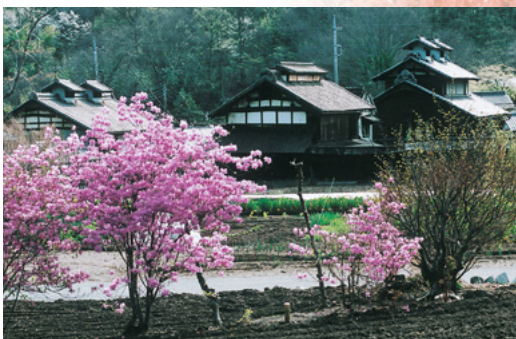
水押川の曼珠沙華

高窓の里 かつて、養蚕業が盛んだった頃に造られた高窓のある養蚕農家が、いまも数軒残っています。屋根の上に小屋根があり、蚕室の換気用の窓が設けられています。そこから高窓の家と言われています。