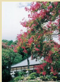
二十九番札所 光福寺