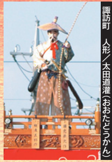
諏訪町 人形／太田道灌(おたごみかん)