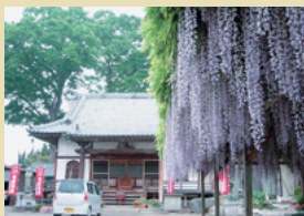
二十番札所 正観寺