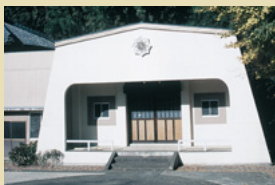
十一番札所 本覚院