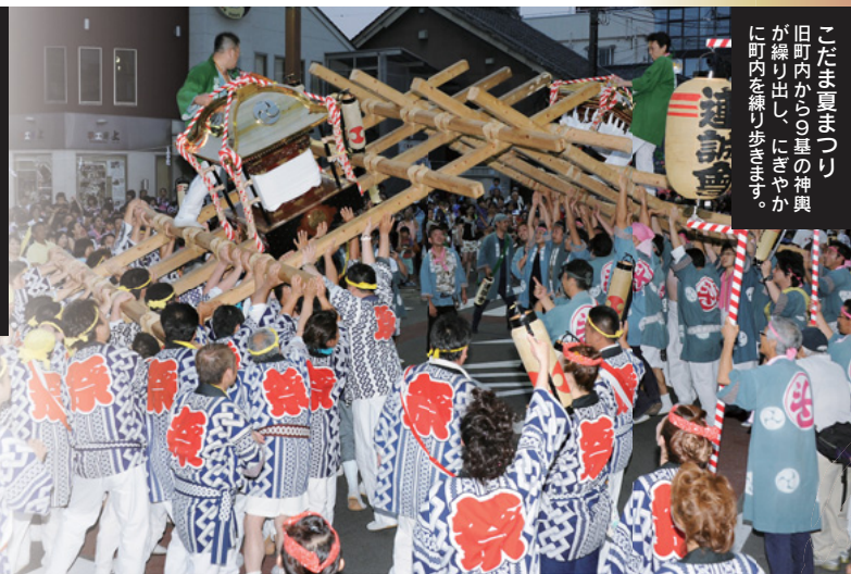
こだま夏まつり 旧町内からの基の神輿が繰り出し、にぎやかに町内を繰り歩きます。