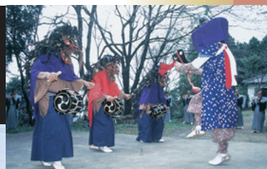
吉林獅子舞 (市指定無形民俗文化財) 文政9年の頃より起こり、その後悪疫流行の厄払いと干ばつの際の雨乞いに行っていました。