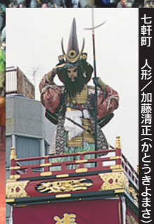
七軒町 人形／加藤清正(かとうきよまさ)