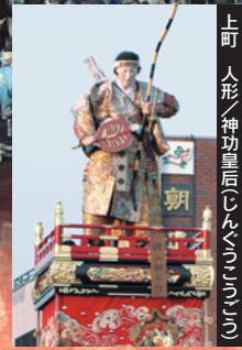
上町 人形／神功皇后(じんくごうごう)