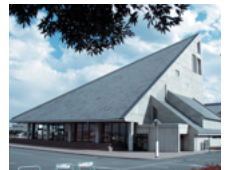
セルティ(児玉総合文化会館)