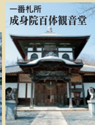
一番札所 成身院百体観音堂