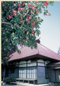
八番札所 長谷観音堂