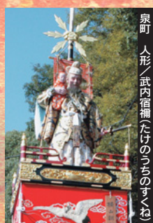
泉町 人形／武内宿禰(たけのくにすくね)