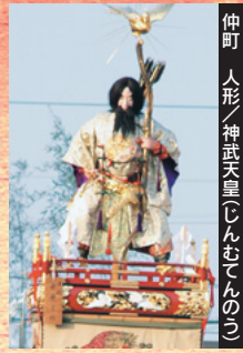
仲町 人形／神武天皇(じんむてんのみこと)