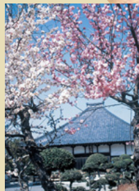
二十七番札所 龍清寺