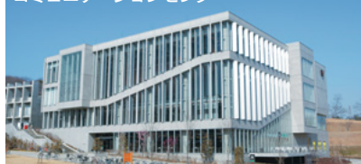
早稲田リサーチパーク コミュニケーションセンター

地域全体の連携拠点として、研究開発、人材育成、情報交流やコミュニケーション活動を展開しています。企業や地域住民に開かれた施設として、産学・公・地域が一丸となつての地域づくりを進めるための中核拠点です。