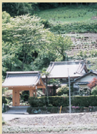
三十二番札所 光福寺