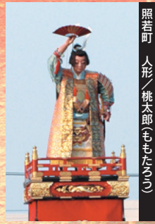
照若町 人形／桃太郎(ももたろう)