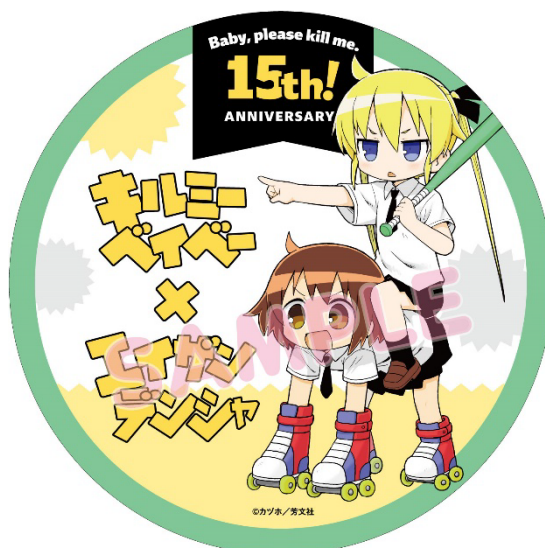
コラボヘッドマークのイメージ