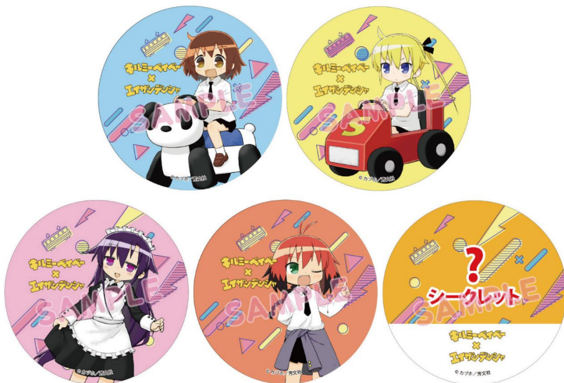
コラボ缶バッジのイメージ