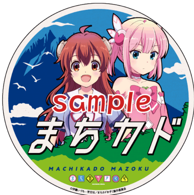
コラボヘッドマークのイメージ