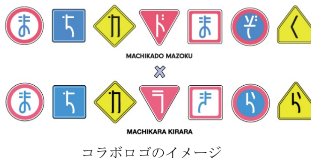
コラボロゴのイメージ