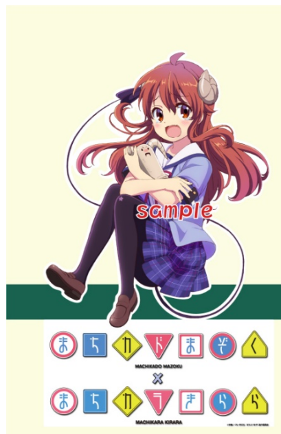
側面ラッピングイメージ