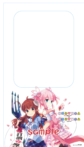
車内ラッピングのイメージ