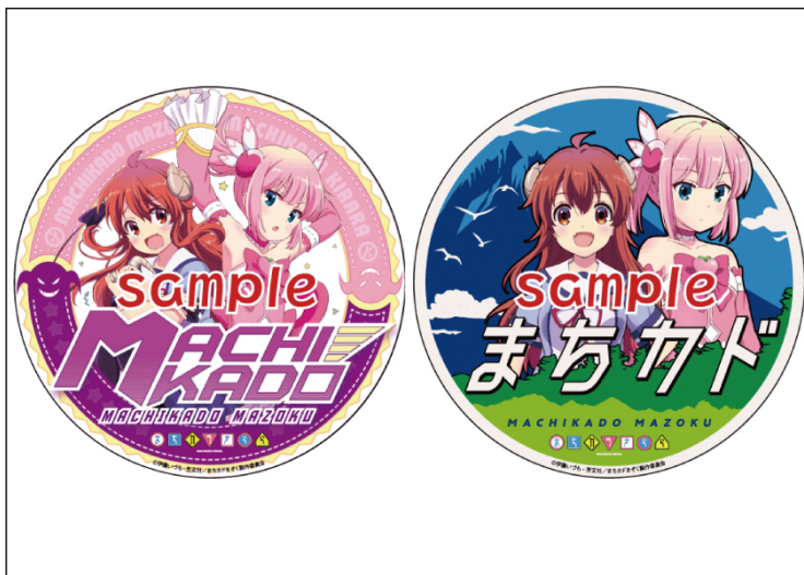
コラボヘッドマークステッカーのイメージ