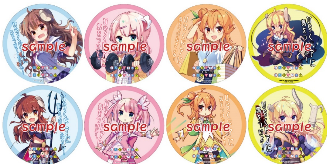
ドアステッカーのイメージ