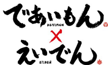
コラボロゴのイメージ