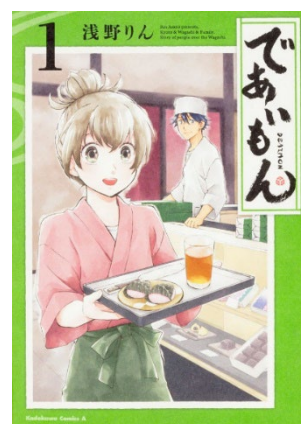
『であいもん』①巻書影