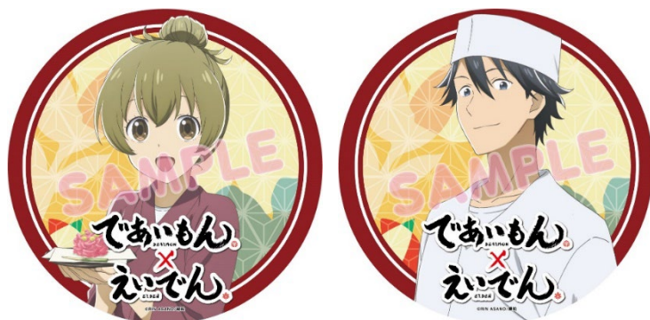
ヘッドマークのイメージ