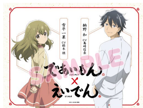
車内ドアラッピングのイメージ