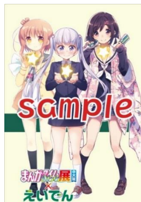
側面ラッピングイメージ