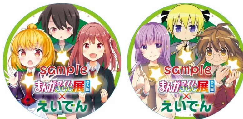
コラボヘッドマークのイメージ