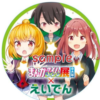
コラボヘッドマークのイメージ