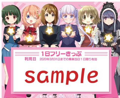
● 1日乗車券「1日フリーきっぷ」【表面】