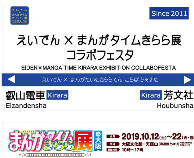
コラボ駅名標のイメージ