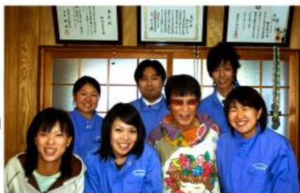
鈴木さん親子とわかさ生活スタッフ