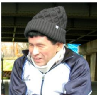
「絶対完走します」と決意をあらたにする東さん。

東さん 本当は10kmの部に参加したいところですが、今回は3kmの部に出場します。ひざを故障しているので、今回は断念しようかと迷いました。しかし、今までこの大会を目標に練習してきた仲間と一緒に走りたいので、出場を決意しました。それに賀茂川パートナーズにとってこの大会への出場は毎年恒例なので、出ないとなると寂しいですよ。途中で歩いてでも絶対完走します！