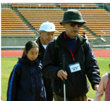
手引き体験をすることで、初めてわかることがたくさんありました。

2人をつなぐ「タスキ」は、互いのリズム、心音、相手を思う心と心をつなぐ信頼の証。だからこそ、ランナーの間では「絆」と呼ばれています。それぞれの想いを胸に、ランナーと伴走者たちはゴールまでの道のりを共に頑張り、楽しんでいるようでした。25回目を迎える今回は、過去最多となるランナーが出場。盲導犬と走ったり、家族とのペアで走るランナーの姿も多く見られました。競技を終えたランナーから、「楽しく走ることができました!」「毎年この大会に出場するのを楽しみにしているんですよ」など、嬉しい声を聞くことができました。