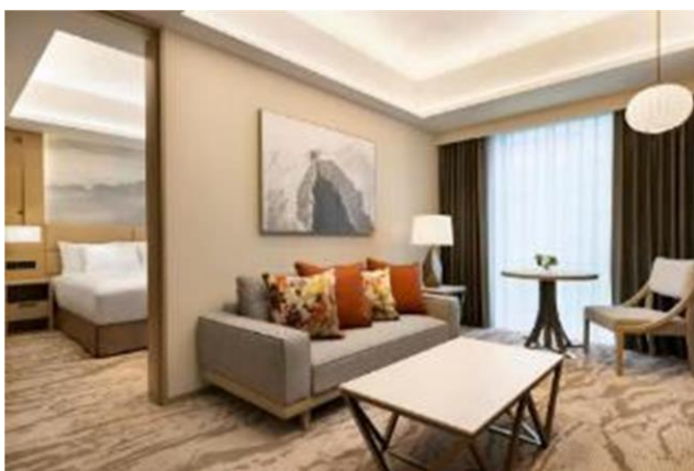
デラックススイート

プレミアムスイート(79 平米)1 室、デラックススイート(52 平米)4 室のスイート・ルームの他、客室は同地域では比較的広めの 26 平米を中心に備えています。全客室階にウォーターディスペンサーが設置され、良質な富山