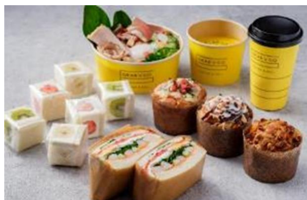
「GRAB'n'GO Coffee & Deli」