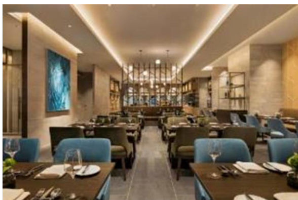
「korare WINE AND DINE」

富山弁で「おいでよ」を意味する「来られ(korare)」を店名にしたオールデイダイニング「korare WINE AND DINE」。テーブル席 78 席と個室 10 席を備え、ライブキッチンが配されたビュッフェエリアとダイニングエリアでは、朝食、ランチ、アフタヌーンティー、ディナーまであらゆるシーンの食事を提供します。富山湾で獲れた新鮮な魚介や富山県産ビーフ他、ソムリエが料理に合うワインもお勧めします。