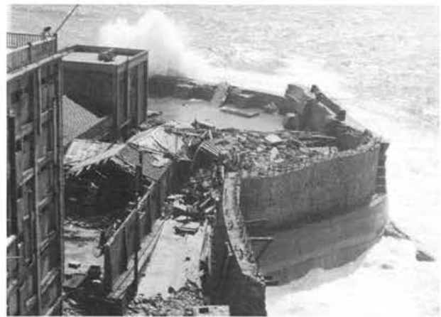
写真-2 南部護岸付近住家の破壊(台風9号・12号)