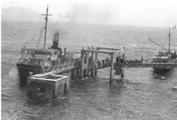
写真-11 第2次ドルフィン栈橋

特別委員会が設置され、三菱社も側面援助して、ついに「ドルフィン栈橋」の構想にたどり着いた。長崎県が主体となり九州大学港湾専門家の協力もあって、設計が出来上がった。