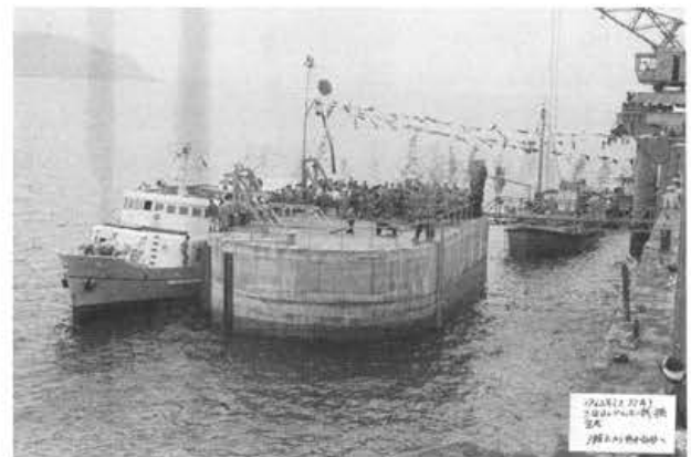
写真-12 第3次ドルフィン栈橋