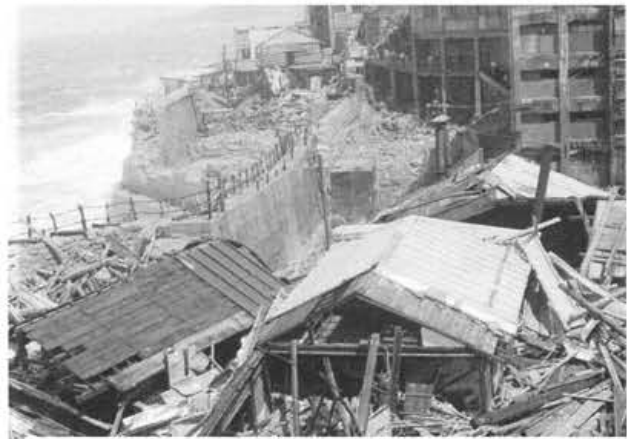
写真-7 台風12号による西海岸坑員社宅の崩壊状況