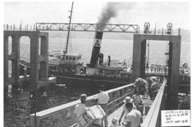
写真-10 第1次ドルフィン栈橋

第2次のドルフィン栈橋の建設は、端島島民の切なる願いで長崎県の災害復旧工事として取り上げられ、波高7mに対して安全な設計がなされた。ドルフィン栈橋の主体を鉄骨として、海底地盤を干潮面から9mまで掘り下げ、岩盤に鉄骨の脚を建て込んで基礎を強化したうえ、波浪に対する抵抗を少なくするため、鉄骨周りにプレキャストコンクリート(水中コンクリート打設工法的一种)を施した。