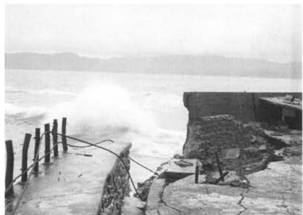
写真-4 南部護岸の決壊詳細(台風9号・12号)