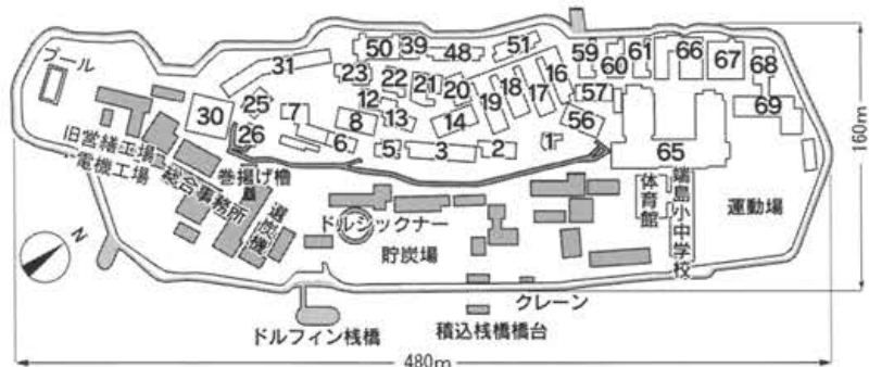
図-1 閉山時の施設配置（数字は棟番号）