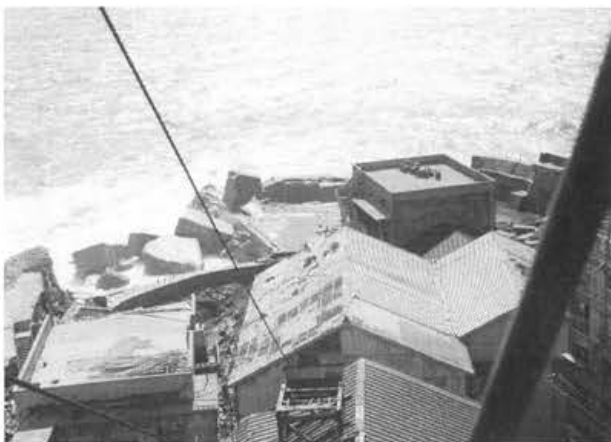
写真-3 南部護岸の決壊状況(台風9号・12号)