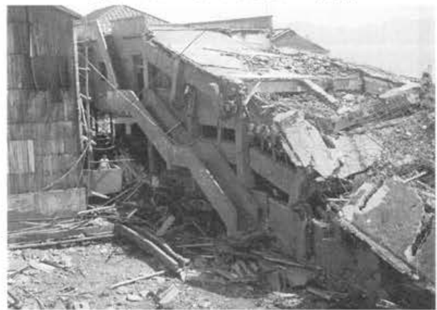
写真-6 台風12号により崩壊した営繕工場・電機工場