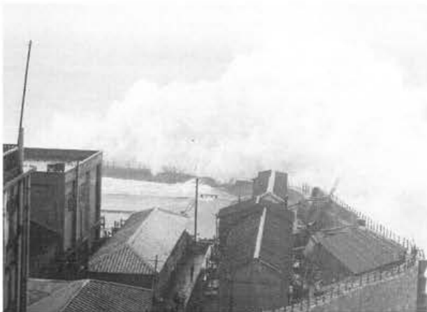
写真-1 南部護岸に打ち寄せる大波(台風9号・12号)

台風9号で端島坑は、高島からの送電線の切断で完全に採炭ストップに陥った。台風被害によって炭鉱が採炭を完全にストップしたのは、今次台風が初めてである。送電ケーブル7本のうち6本が波浪被害により故障したため、下部坑道の一部が浸水したものの危険はなかった。ほかに、15トンクレーンが半壊、貯炭300トンが流