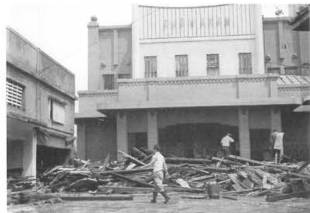
写真-8 台風14号による映画館の被害状況