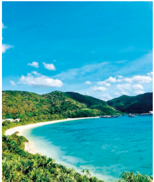
慶良間諸島最大の島、渡嘉敷島 Tokashiki Island, the largest of the Kerama Islands

沖縄の役人は、持続可能な観光の発展に対して無関心ではありませんでした。彼らはその重要性を認識しました。たとえば、沖縄県は、島の主要な経済的要因であるため、2012年に観光開発の10年計画を発表しました。この計画によると、6つの主要な問題が解決され、環境問題や観光の持続可能性も含まれていました。観光客を沖縄に追いやる主な要因は、海、森林、生物多様性として特定され、これらの3つの要因の強力な保存が強調されました。この計画が終了するまで、その影響を評価するために、さらに2年の会計年度があります。しかし、政府と市民がとった行動はすでに見ることができます。たとえば、エコツアーは沖縄周辺の観光代理店が基本的に提供しているものの1つです。エコツアーの助けを借りて、観光客は環境を損なうことなくそれらの場所について学びながら、沖縄の風光明媚な歴史的な場所を訪れます。ビーチ訪問に適用できるエコツアーの例の1つは、水泳と日光浴の目的でビーチを訪問することで