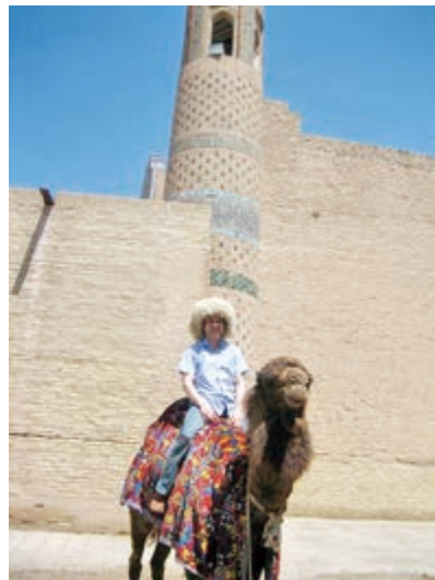
ウズベキスタン、ヒヴァにて in Khiva, Uzbekistan

NipCA project has been organizing various events and activities. NipCA project gives young aspiring students from five Central Asian republics and Azerbaijan the opportunity to obtain a master's degree from the Graduate School