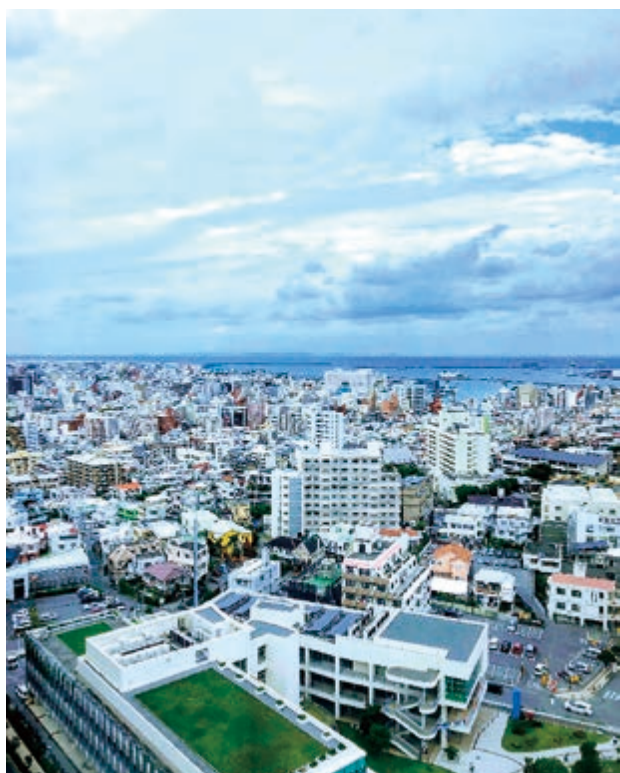
那覇市の眺め The scenery in Naha, Okinawa

あなたが泳ぐのが得意な人であろうとなかろうと、日本の沖縄は訪問に値します。沖縄は太平洋の 100 を超える島から成り、そのうち 47 に人が住んでいます。県の主要な交通機関の中心は、那覇市にあります。高層ビルと娯楽施設の多い島都市です。那覇にいて、際立った魚市場の 1 つを通り過ぎない限り、小さな島にいることにはほとんど気づきません。しかし、都市生活は沖縄を訪れる動機ではなく、驚くべきビーチがあり、この記事で書くのはその驚くべき歴史に関してでもありません。