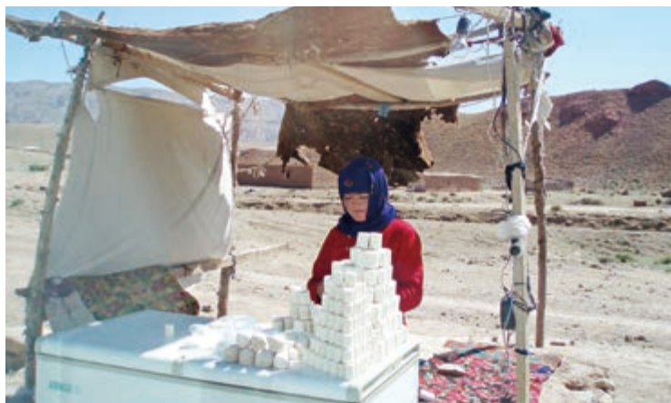
道端でクルトを売る少女。ウズベキスタンにて。(写真提供：宗野ふもと氏) A girl selling Qurut on the street. Uzbekistan. (photo by Sono Fumoto)