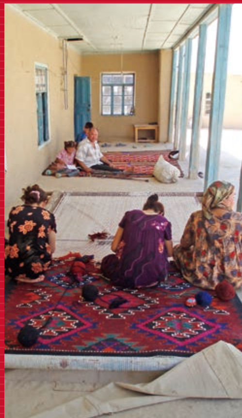
絨毯を織る女性たち。ウズベキスタン。 Women weaving a carpet. Uzbekistan.

10月には本プロジェクト人材育成事業の柱である第2期NipCAフェロー8名も入学しました。こちらもコロナ禍の影響を受け、いまだ来日を果たせず母国でオンライン授業を受けている状況です。次号では、今年度のオンラインイベントの模様を詳しくお伝えするとともに、第2期NipCAフェローの紹介も予定しています。1日でも早く世界に平穏が訪れることを祈願すると共に、NipCAプロジェクトは、今後も時代や状況に即した新しい試みに挑戦していきます。