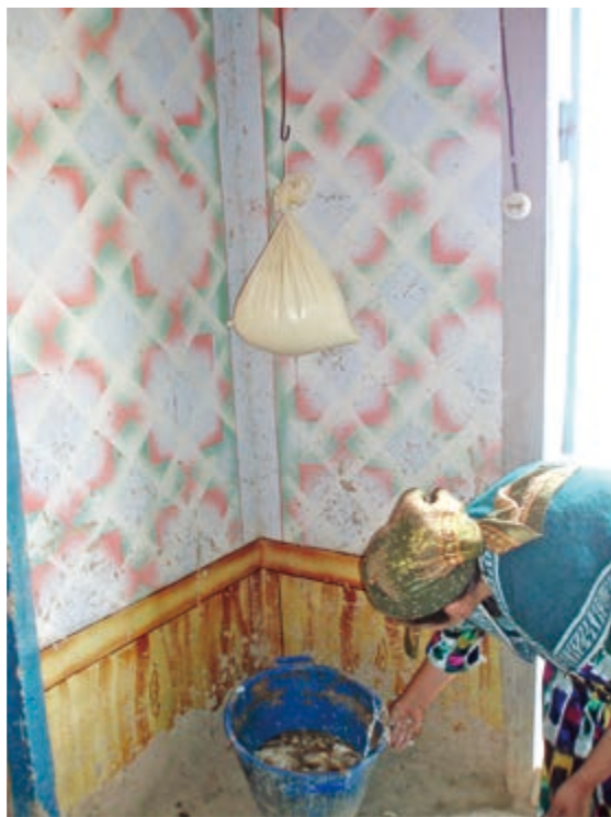
写真②:カティクの水(ホエー)を切っているところ。ホエーは牛の餌になる。

Photo (2): Watering down the Qatiq water (The whey). Whey is used for the cattles' bait.