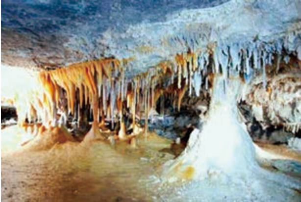
トルクメニスタンの洞窟 Caves in Turkmenistan

もあります。将来、クリスタルの地下王国の独特の美しさを見てみたいという、膨大な数の人々がコイテンダグを利用できるようになることは間違いありません。確かに、それは洞窟の脆弱な環境にとっては非常に挑戦的な活動になるでしょう。この意味で、沖縄の玉泉洞への私の訪問は日本での持続可能な観光政策の実施についての知識を得る機会となり、トルクメニスタンの事例に適用できる貴重な経験となりました。