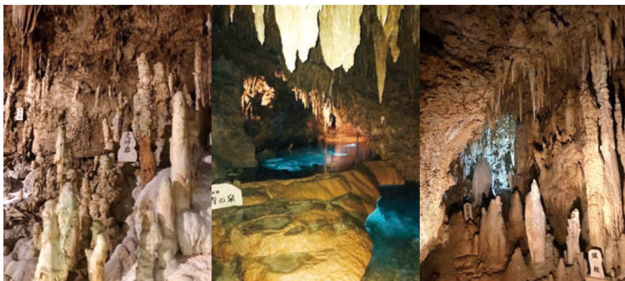
玉泉洞の洞窟 Caves in Okinawa

Gyokusendo Cave is located in the Okinawa World, a theme park about Okinawan culture. It is the second longest cave in Japan with a total length of three miles. Despite the fact that only 890 meters of this long cave is open for visitors, it was enough for me to witness a beauty of this underground world made of stone of water. Immediately at the entrance of the Figure 1. Stalactites and blue fountains of Gyokusendo Cave we stepped on a comfortable path which led us downwards through the gallery to the hall with stunning stalactites and stalagmites of various size and shapes. The biggest hall of the cave is larger in comparison to the main pavilion of Shuri Castle. According to different estimates, the total number of stalactites in Gyokusendo Cave is over one million. There are about 30 types of stalactites in the cave and some of them are huge. For example, one of the most interesting stalactite shapes in the cave is called 'The Bell of the Rising Dragon' while others may look as stone curtains.