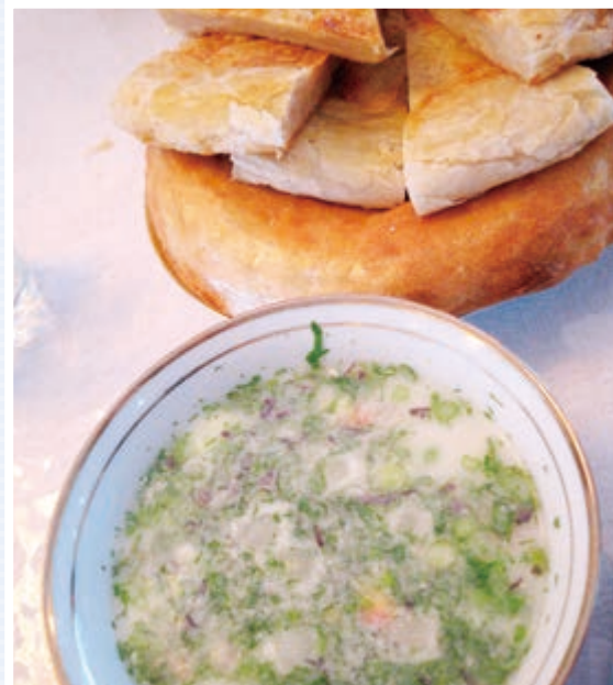
写真④: キュウリや薬味を入れたチャロップ。

In the future, if it comes to more common to sell raw milk, the necessities to process and store raw milk at home would decrease. This would reduce the opportunities to make Chakka and Kurt at home; however, Chakka keeps for long time and has rich nutrition. Therefore, it may not happen that the importance of them would decrease in the diet and the various ways to eat such as Chalob and Kurt would decline. In the future, how do the situation of the dairy products in the village change? Will a day come that ready-made Chakka would serve at the dinner tables in the village, or has the dairy making at home been maintained? I would like to continue observing with my interests.