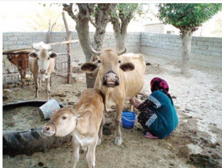
写真①：牛の乳しぼりは必ず毎日、多い時は朝晩行う。村の女性の重要な仕事である。

(1) Using the Chakka as it is. Put Chakka on salad, put it in a soup, use it to garnish a main dish, and have it with bread (Photo (3)). Chakka is rich with