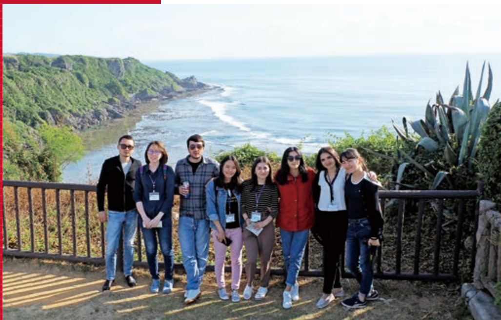
NipCA フェロー、沖縄 平和記念公園にて NipCA Fellows at Peace Memorial Park, Okinawa