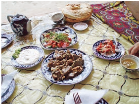
写真③: 羊肉を煮込んだジズという料理。傍らの小皿にはチャックと青唐辛子がある。

Photo (3): A dish called Jiz which is the sheep meat stew. A small dish beside it has Chakka and a green chili.