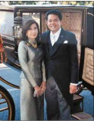
Во время церемонии вручения верительных грамот Его Величеству Императору Японии Акихито. 2012 г.