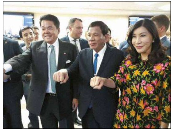
После церемонии присуждения почетного звания доктора МГИМО президенту Республики Филиппины Родриго Дутерте. 2019 г.

Федерации в Москве и ВУНЦ ВМФ «Военно-морская академия» в Санкт-Петербурге. В июле 2018 года делегация ВМС Таиланда присутствовала на Главном военно-морском параде в Санкт-Петербурге.