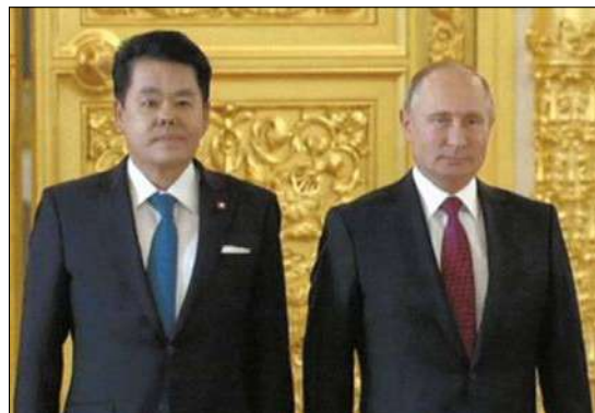
После церемонии вручения верительных грамот президенту России В.В. Путину. 2018 г.