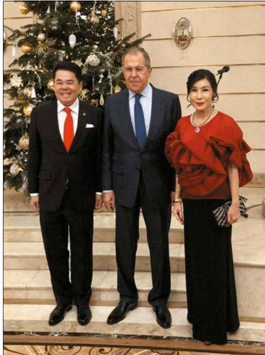
Новогодний вечер в Большом театре. 2019 г.

В последние годы двусторонний политический диалог между нашими странами приобрел более активную динамику. Проводились разносторонние встречи на самом высоком уровне в форматах официальных визитов: встречи президента В.В. Путина с премьер-министром П.Чан-Очой в мае 2016 года в Сочи «на полях» саммита Россия — Ассоциация государств Юго-Восточной Азии (АСЕАН) и в сентябре в Сямэне в рамках саммита БРИКС. В 2018 году они вновь встретились на саммите Россия — АСЕАН в Сингапуре и подчеркнули желание укреплять дружественные отношения, продолжать межгосударственное сотрудничество, в частности развивать торгово-экономические и гуманитарные связи. Осу-