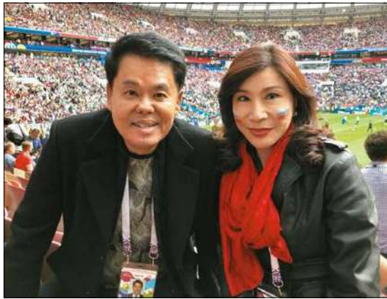
На Чемпионате мира по футболу ФИФА 2018 года в Москве