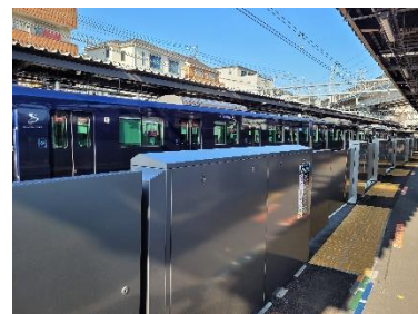
西谷駅 ホームドア

駅ホームにおける安全性向上のため、相鉄線全駅にホームドアを順次設置しています。今年度は、瀬谷(1・4番線)、三ツ境、南万騎が原、緑園都市、弥生台、いずみ野、いずみ中央の7駅に設置する予定です。なお、ホームドアの設置にあたっては、国および地方自治体の協力のもと進めており、2021年度までに11駅に設置が完了しています。