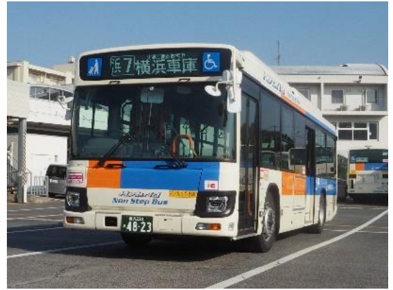
導入予定のハイブリッドバス

ドライバー異常時対応システム (EDSS) ※3 付きバス 18 両 (うちハイブリッドバス※4 7 両を含む)、コミュニティバス 1 両を導入します。