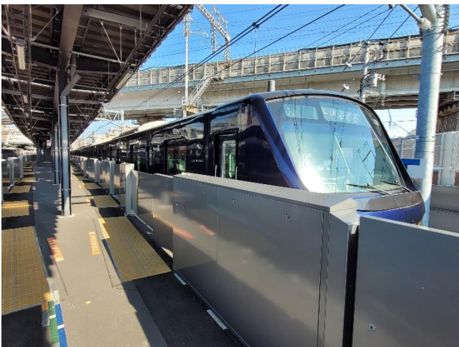
相鉄線 西谷駅に設置したホームドア