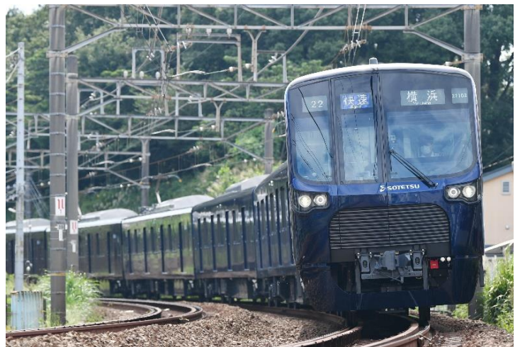
相鉄・東急直通線の開業に向けて順次導入する「21000系」（東急線内は目黒線直通用）