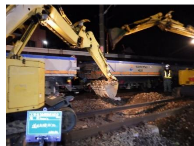
軌道改良工事の様子

今年度も引き続き、本線の軌道改良(主に道床 ※2 の交換)を実施し、列車走行の安全性強化を図ります。