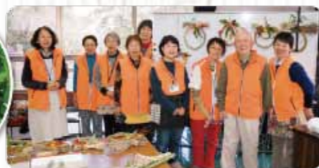
ハーブボランティアの皆さん