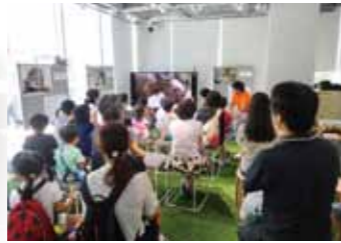
夏休みの自由研究に役立つかな?