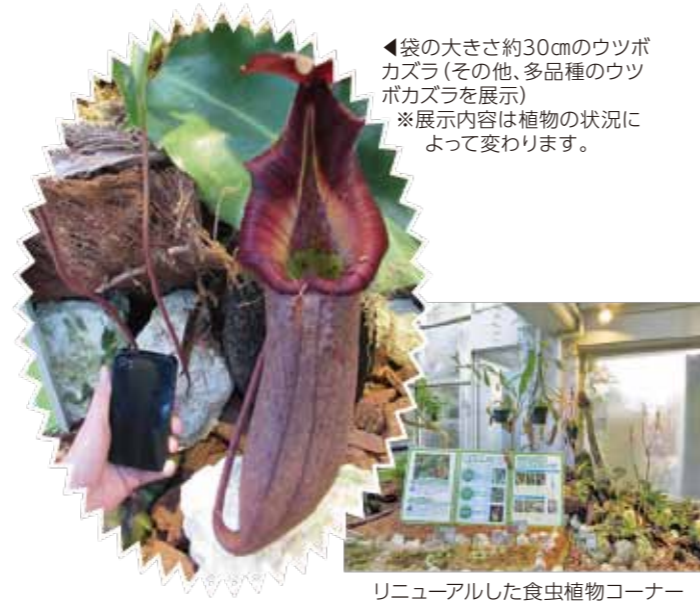
◀袋の大きさ約30cmのウツボカズラ(その他、多品種のウツボカズラを展示) ※展示内容は植物の状況によって変わります。

場所/温室 大温室 展示植物/ウツボカズラ、サラセニア、ハエトリグサ、ムシトリスミレ、モウセンゴケ ※常設展示