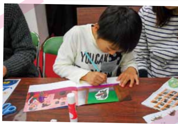
自分で考えた物語を書き込みます