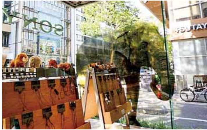
迫力満点、等身大のはな子

ソニーストア福岡天神さまと共同で、2016年8月1日～19日、写真展・トークイベントを開催しました。店内に動物たちの写真を展示し、窓にはゾウやキリンの等身大写真シートが掲示されました。店内では動物たちを超高画質で撮影した4K映像も上映。8月10日の動物トークイベントでは、あざやかな映像を見ながら飼育員が解説を行いました。