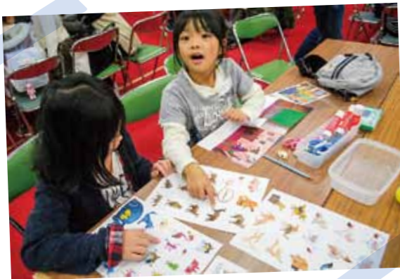
どんな動物が登場するのかな?