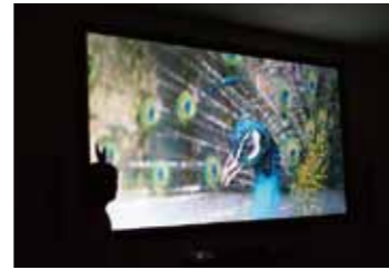
4K映像は「夜の動植物園」でも上映