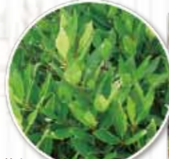
月桂樹の葉を乾燥させると香辛料(ローリエ)に

※コンパニオンプランツ(共栄作物)とは、近くに植えることで良い影響が期待できる植物。例えば野菜類とハーブを組み合わせると一緒に植えると生長促進や防虫など様々な効果を生むことがあるとされる