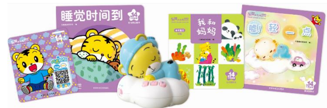
中国版「こどもちゃれんじ」 「楽智小天地」

中国国内では各地に拠点を置き、各エリアのフェーズや特徴にあわせたマーケティングを行っています。また、最近では従来の店舗での顧客接点やクチコミづくりに加えて、ウェブやSNSなどのオンライン施策にも力を入れています。