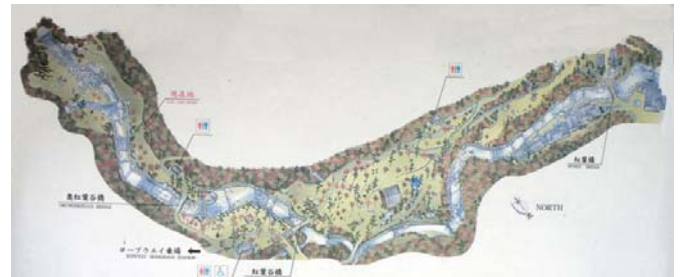
図 1 紅葉谷公園

昭和 23 年から、入念な工事をするを課題とし、地元住民・国・県・町・学識者らの声をもとに復旧工事が計画された。しかし、宮島は大正 12 年に史跡名勝の指定を受けており、復旧工事にあたっては砂防施設も史跡名勝を損なってはいけない為、治水上の要請と一致させる必要があった。