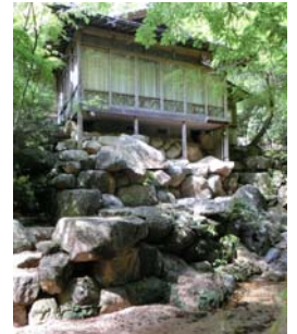
写真 1 龍門亭

老舗旅館の離れの中でも、龍門亭の東石は、紅葉谷川の庭園砂防と一体化しているように見える。この石はもともと龍門亭が建てられた時に造られていたものである。老舗旅館と庭園砂防との敷地境界線は道の砂防側にある。龍門亭付近も枕崎台風時に被害を受けたが、