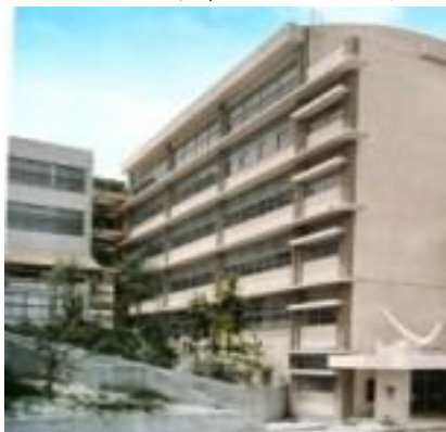
講堂兼体育館 2012年4月1日撮影