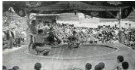
記念誌より 横綱土俵入り

1952(S27)年09月26日 第3次校舎増築工事竣工 (鉄筋コンクリート建 3階1棟教室)