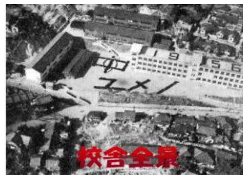
夢野中学校HP掲載の写真

右の写真は夢野中学校HP「沿革」 欄に掲載されているもので、東校 舎屋上の人文字にあるとおり、 1956年撮影の航空写真であろう。 西校舎前の校庭には、プレハブ教 室のような建物が見える。