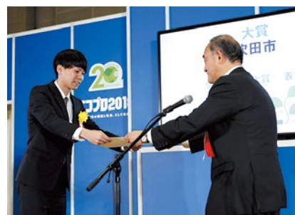
「第19回グリーン購入大賞」表彰式にて

吹 田市は、「第19回グリーン購入大賞」の行政・民間団体部門において大賞を受賞した。同賞は、環境に配慮した製品やサービスを、環境負荷の低減に努める事業者から優先的に購入した団体を表彰するもので、環境省や経産省などが後援する。市は、2017年に「吹田市電力の調達に係る環境配慮方針」を策定し、市内の公共施設の電力調達契約に際して、太陽光発電などの再生可能エネルギー比率を主な条件とした競争入札を実施している。国や他の多くの自治体がCO2排出量の少なさを基準とした入札を行っている中、再エネ比率を主な評価項目とした同市の取り組みは