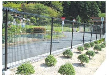
ブロック塀を撤去し、フェンスを新設した事例。

昨年6月18日に発生した大阪北部地震によるブロック塀の倒壊被害を受け、ブロック塀の危険性に関する認知度が高まり、北摂各市でも市立小・中学校などのブロック塀の撤去が進められている。