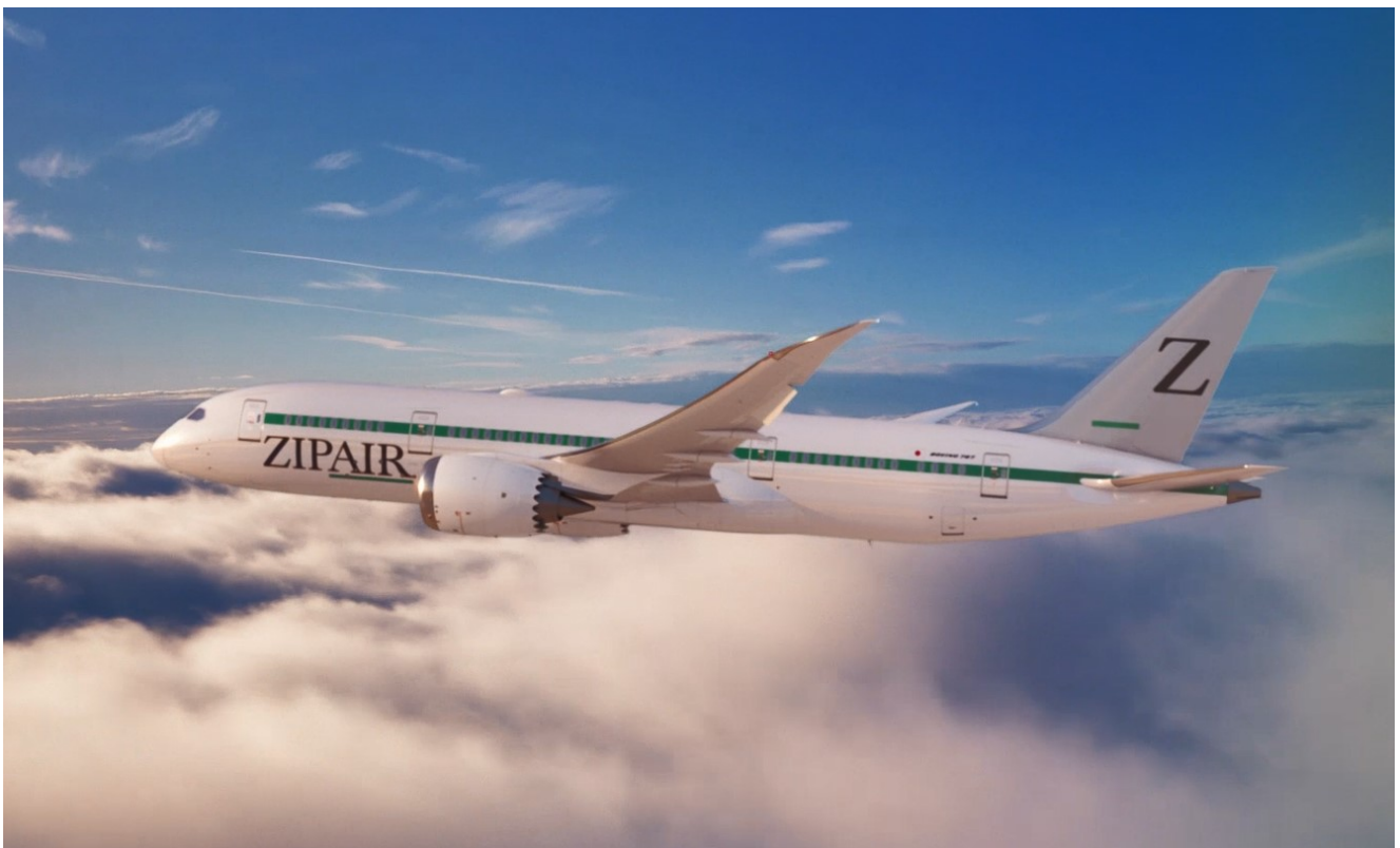
(機体デザインのイメージ)

垂直尾翼にはコーポレートカラーのグレーをベースに、シンボルマークを配しました。また、機体側面には前後へ伸びやかに続くひと筋の細いグリーンラインを入れ、矢が「ビュツ(=ZIP)」と飛ぶように、目的地へ向かって一直線に大空を飛び行く姿をイメージしました。