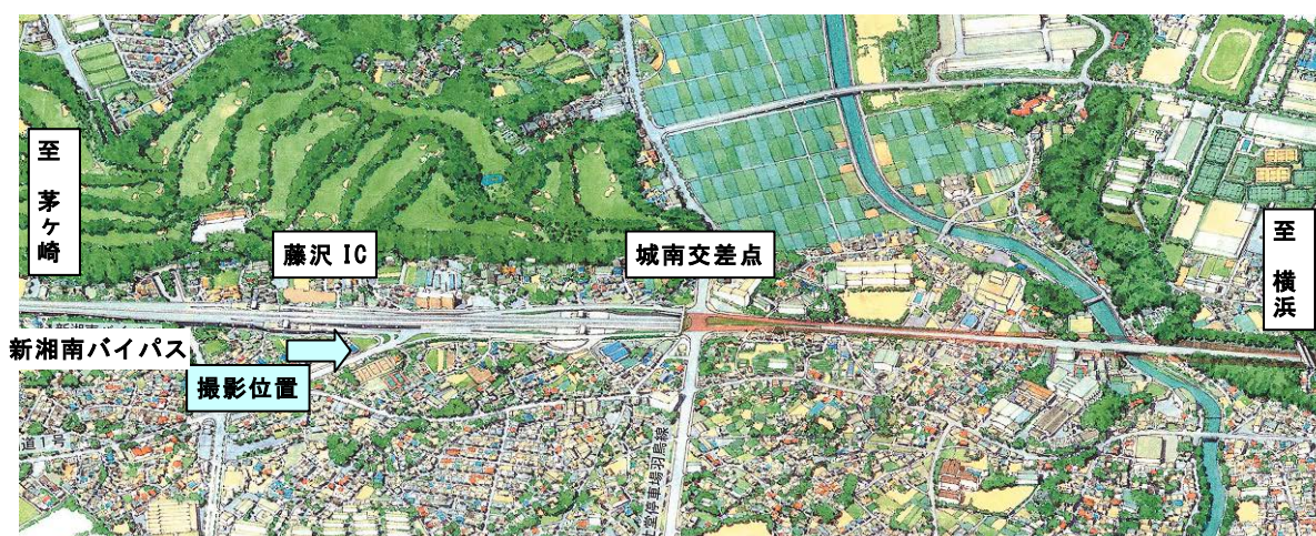
藤沢 IC ONランプ工事状況