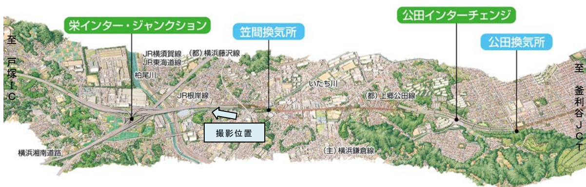
栄IC・JCT 付近(飯島地区)工事状況