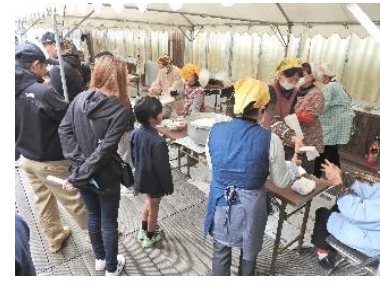
ソメイヨシノ記念植樹・記念航空撮影・昼食バザーの様子