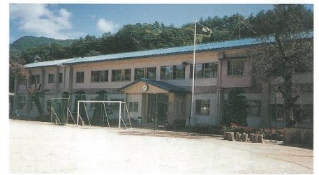
阿東町立三谷小学校

さくら小学校が開校した当初は学級数7・児童数124名であったが、20年という歳月が過ぎる間に徐々に子供の数は減少し、令和元年度は学級数6・児童数44名になった。平成19・20年度にコミュニティー・スクール推進のための調査研究事業を受け、平成21