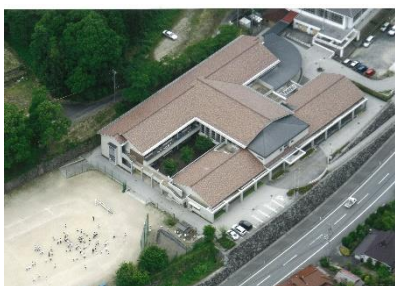
山口市立(旧阿東町立)さくら小学校

さくら小学校が開校した当初は学級数7・児童数124名であったが、20年という歳月が過ぎる間に徐々に子供の数は減少し、令和元年度は学級数6・児童数44名になった。平成19・20年度にコミュニティー・スクール推進のための調査研究事業を受け、平成21