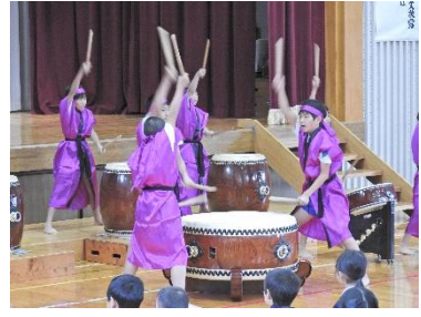
令和元年度 さくらっ子発表会（学習発表会）の様子