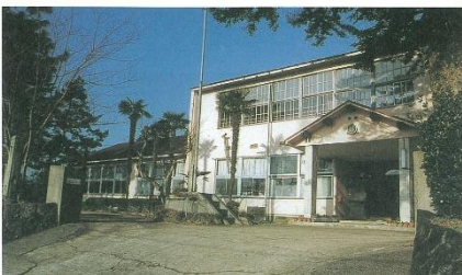
阿東町立地福小学校

旧阿東町は、山口県北部に位置する中山間地域である。他の地域と同様、少子高齢化に悩む過疎化の進む地域である。当然、児童数は減少し、篠目・三谷小学校は複式学級化を余儀なくされた。教育の原点は複式であることは理解されながらも、「多様な意見に接する機会が少ない、友人関係が固定化する」など小規模校では解決しがたい課題も少なくなかった。「ドッチボールを思い切り投げてみたい」という高学年の思いは、保護者・地域の心を大きく動かし、再三にわたって保護者・地域と教育委員会と協議を重ね、三校を統合することになった。