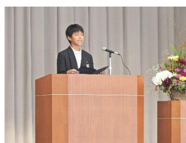
山口市立さくら小学校開校20周年記念式典の様子