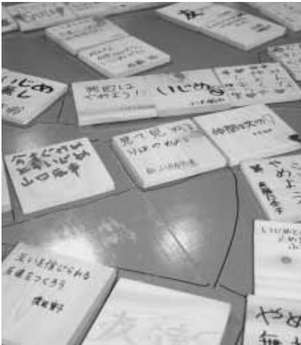
参加した児童・生徒一人ひとりのメッセージが 込められたパネル

この集会は、昨年に引き続き村教育委員会の主催で行われたもの。この集会を通して児童・生徒一人ひとりが、いじめに対する意識を高め、学校や家庭、地域が一体となっていくことを許さない社会にしていくことを目的に実施しています。