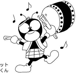
国民年金マスコット ゆめありくん

将来受給する老齢基礎年金を増額する方法として、通常の保険料に月々400円の付加保険料を加えて納付し、付加年金を受給する方法があります。