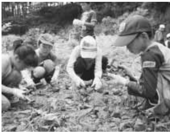
夢中で化石を探す子どもたち

変わらないでいてくれるのが一番ですね。子どもの頃から見知ったお店などは、帰ってきた時に「まだやってるんだ」と、思うだけで嬉しくなります。