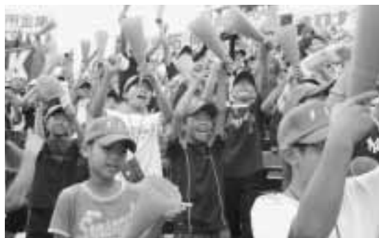
甲子園で声援を送る応援団