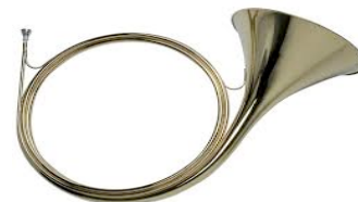
Corno da caccia

Si presume che intorno alla metà del 1500 il corno fosse costituito da un lungo tubo metallico avvolto su se stesso a forma di cerchio che terminava con un'imboccatura fissa (bocchino) a forma di tazza ad una estremità, e con una larga apertura svasata dall'altra detta padiglione o campana. Questi strumenti, dai quali potevano uscire solo alcune note di base (suoni naturali) di una certa scala mediante la sola variazione della pressione delle labbra sul bocchino, erano utilizzati prevalentemente per lanciare dei segnali nei campi di battaglia o per dei richiami e annunci d'importanti notizie