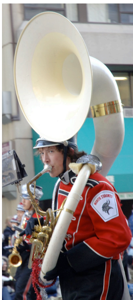
Suonatore di Sousaphon

Esiste uno strumento di forma particolare conosciuto come Sousaphon (dal cognome del famoso compositore di marce J. Philip Sousa ) con il padiglione slanciato e rivolto in avanti ed utilizzato nelle "marching band" e nei gruppi tradizionali di musica dixieland a New Orleans.