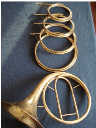
Corno naturale con ritorti

Agli inizi del XVIII secolo ci fu un'importante innovazione da parte dei fratelli Leichnamschneider di Vienna che realizzarono il primo corno naturale con un sistema di adattatori melodici che consistevano in porzioni di tubo di varie lunghezze (ritorti) che il cornista inseriva sullo strumento per modificarne la lunghezza totale della colonna d'aria all'interno dello strumento e quindi l'intonazione in funzione delle note da eseguire potendo così suonare brani in tonalità diverse. I compositori, che avevano iniziato a scrivere musica per corno, lasciavano nelle composizioni delle pause per permettere allo strumentista di cambiare il ritorto quando richiesto.