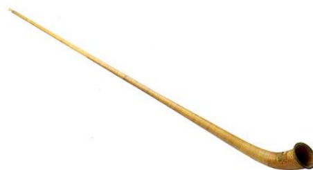
Corno delle Alpi

È un curioso strumento aerofono labiale di grandi dimensioni, di antica origine, che è suonato nelle Alpi svizzere, nella regione dei Carpazi della Polonia e della Romania, in Lituania e in Scandinavia. Nel XIV secolo era principalmente utilizzato per emettere segnali che potevano essere uditi a grande distanza per il richiamo degli animali al pascolo e per la comunicazione di messaggi sonori codificati. Attualmente è un richiamo turistico nelle rievocazioni storiche. In Lituania è utilizzato per la musica popolare. Lo strumento è stato utilizzato in un brano di Nicola Casagrande dedicato alla Svizzera dal titolo Ottava Expo Variation suonato da Carlo Torlontano con l'orchestra LaVerdi nell'agosto 2015.