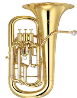
Flicorno baritono - Bombardino

Flicorno tenore , flicorno baritono ed eufonio . Sono tre strumenti con il caneggio di lunghezza identica ma progressivamente più conici: quasi cilindrico nel flicorno tenore, molto più conico nell'eufonio. Il padiglione è rivolto verso l'alto. La denominazione di questi strumenti è molto fuorviante. Per quanto ci riguarda consideriamo il flicorno baritono detto, in Italia, bombardino che ha un timbro scuro ma dolce ideale per melodie cantabili nel registro medio-grave ma anche come strumento di accompagnamento.