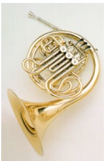
Corno doppio (Fa e Si bem.)

(oltre tre metri) avvolto a spirale che termina con un grande padiglione. Dall'altra estremità c'è il bocchino con la forma d'imbuto. Come per gli altri strumenti a bocchino la produzione del suono è ottenuta dal suonatore regolando le labbra che fungono da doppia ancia quando sono premute contro il bocchino. È munito di tre leve per l'azionamento dei pistoni nei cilindri per la variazione della lunghezza del tubo interessata al percorso dell'aria e quindi determinante per l'altezza della nota. C'è anche una quarta leva per cambiare la tonalità di base dello strumento permettendo così di eseguire agevolmente tutta la scala cromatica. Si tratta di un corno doppio che ha generalmente la possibilità di suonare in tonalità di Fa o di Si bemolle. Ha un'estensione di circa tre ottave ed è tra gli strumenti a fiato uno dei più difficili da suonare. A differenza degli altri ottoni, i pistoni sono azionati con la mano sinistra e, quando si suona, la campana (padiglione) è rivolta all'indietro.